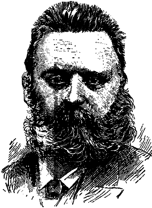
John Most — "dynamiiittiofin isä".

monessakin suhteessa historialliseen taisteluun valmistauduttiin molemmin puolin.