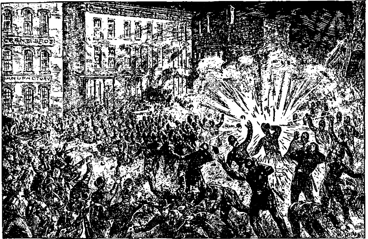
Paljon puhuttu Haymarketin räjähdys kuvattuna.

nokasta, sattuvaa ja selvää. Hyvin ymmärrettävistä syistä heidän agitatsiooninsa niissä oloissa täytyi sellaista olla, vaikka ei se pitemmän päälle katsoen tuonutkaan parhainta mahdollista tulosta — lopulta se toi tuhon omalle liikkeelleen.