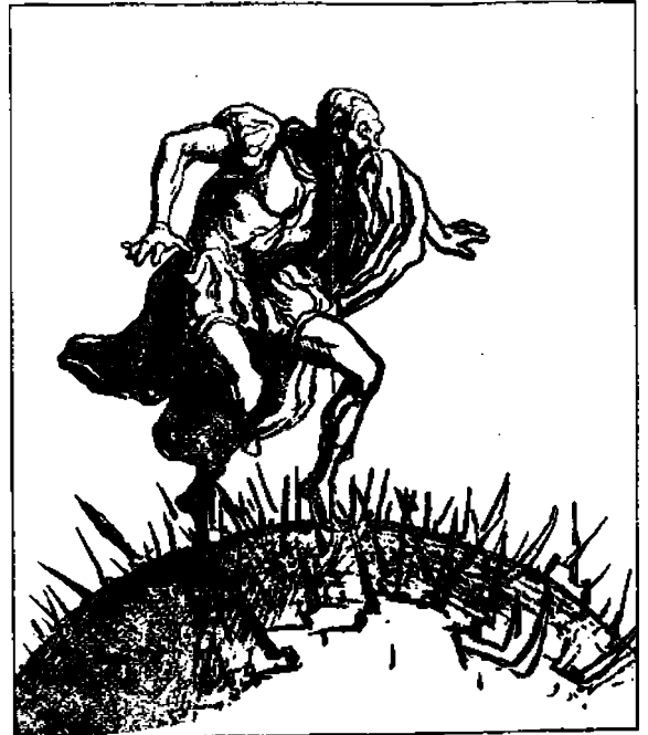
Jos kuudennelatoista vuosisadalla elänyt ja inkvisitionioikeudessa kuolemaan tuomittu Gallei, italialainen fyysikko, joka totesi maanpinnan muuttuvaisuuden, tulisi nyt maailmaan, niin hän voisi ihmeekseenä nähdä maanpallon muuttuneen "pistimiä kasvavaksi" militaristien laidunmaaksi.

Isänmaan puolustaminen nykyaikana, esimerkiksi tässä maassa, ei tarkoita yksinkertaisesti sitä että olisi tartuttava aseisiin pillien soudessa maahan hyökkääviä vihollisia vastaan. Eipä suinkaan! Viime vuosien, tai vaikka sanoisimme vuosikymmenien, aikana tämän maan työläisten on täytynyt ryhtyä puolustamaan "isänmaatansa" monissa ulkomaissa, Europassa ja aina kaukaisessa idässä ja Siperiassa saakka. Jos joku massiansa palveleva kapitalistinen ryhmä, tai vaikkapa yksilö, onnistuu jossain ulkomaalla hankkimaan joko suoranaisesti rosvoamalla