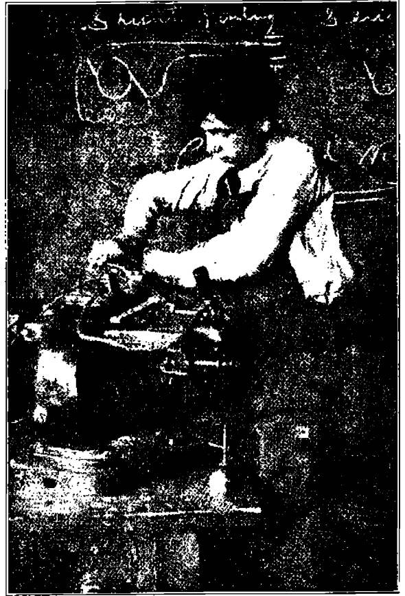
Koululainen, tulevaisuuden koulussa, nyt vielä kapitalismin hyväksi.

Kapitalistiluokka ei kuitenkaan voi luottaa aineelliseen raakaan voimaansa, joka on sen rintaman viimeinen valli. Siihen saakka kun se joutuu perääntymään, niin silloin se on menettänyt säilymismahdollisuutensa. Sillä työväenluokka, kuten sanottu, on sitä nyt jo taloudellisesti ylempi, s. o. sen yhteiskunnallinen merkitys on suurempi kuin kapitalistiluokan. Siksi kapitalistiluok-