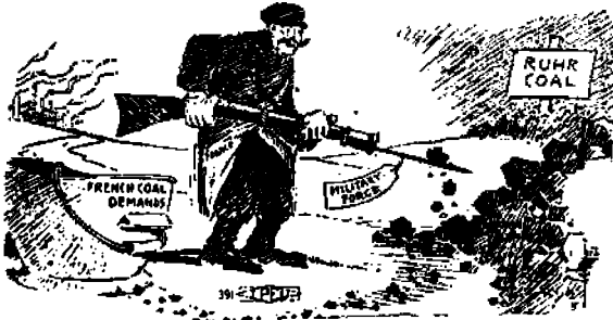
Pistin on huono hiililapioksi.

13 consortiumiksi, trustiksi. Niiden yhteinen pääoma on $900,000,000 dollaria. Tunnetumpia omistajia ovat: Hugo Stinnes, Krup ja Thyssen.