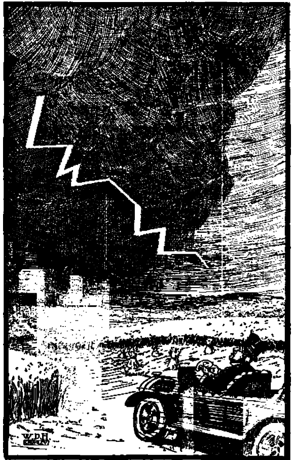
"Jani-Farmari" näkee myrskyn nousevan.