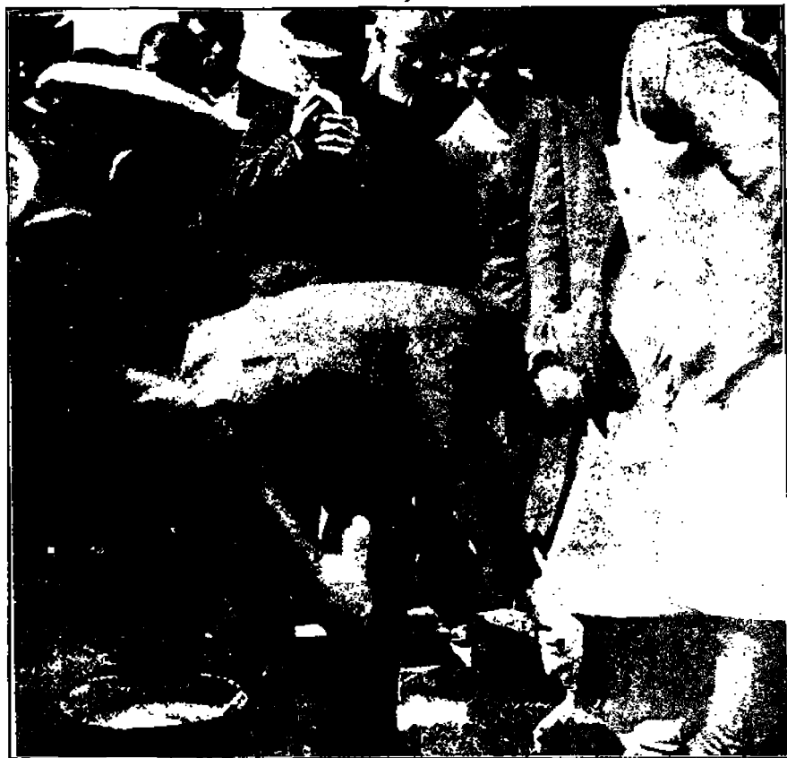
Lenin laskee kulmakliven Karl Marxin muistorakennukselle Moskovassa.

"Voiko kyläkuntakommuni osottautua vaikuttavaksi esteeksi kapitalismin kehitykselle Venäjällä, tuleeko se tuhotuksi kapitalismin kautta tai tuleeko se elämään ja näyttäytymään olevansa