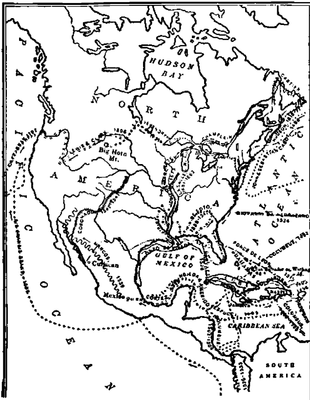
Amerikan löytäjän ja retkeilijän kulkureitit.

Merenkulkijakansana hollantilaisia ei aikaisemmin pidättänyt Amerikasta seik-kailun ja rikkauden etsimishalun puute, mutta heidän vilkas kauppansa itämaiden