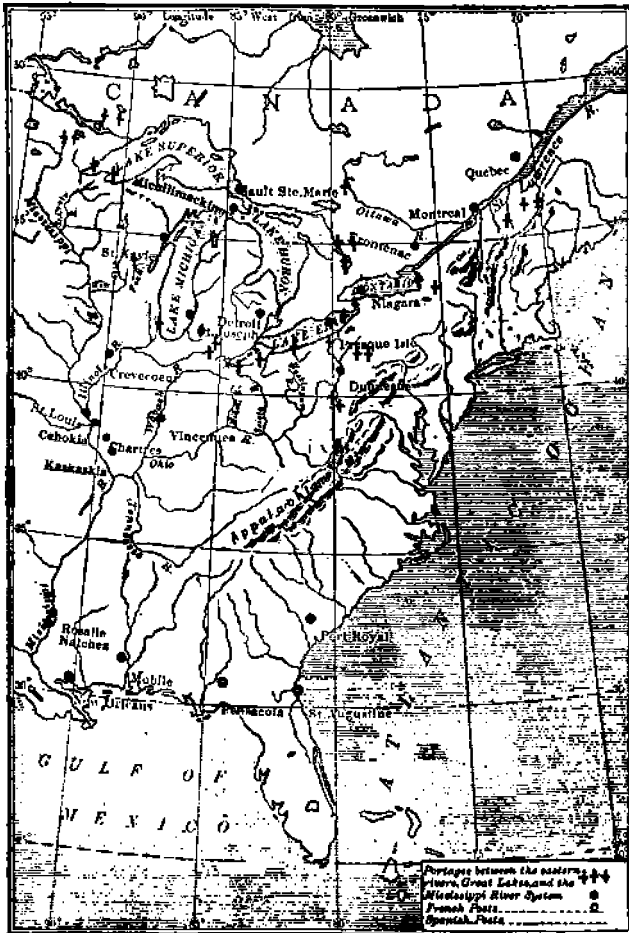
Ruuskatunnen alue Amerikassa suurimmillaan ollessa.

Vuotena 1621 Itä-Indian yhtiö laillistutettiin ja annettiin sille yksinoikeus