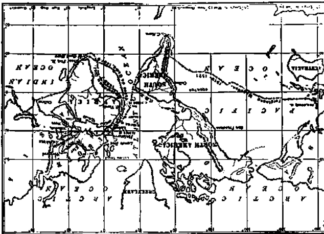
Vuotu ja uusi tie kaukaiseen itään.

Vuotena 1519 Pineda purjehti ylös Mississippijokea ja näki indiaaneilla kultaisia koristuksia, mutta suurempia kultavarastoja ei löytynyt. 1542 kulkivat Narvaezin retkikunnan jäsenet läpi Texasin Rio Grandeen ja yli vuorien Culiacaan, pohjoisimpaan ääreen Mexican alueella. Culiacanista lähtivät myöhemmät seikkailijat etsimään Cibolan kuuluisia "seitsemää kaupunkia" ja niiden satumaisia rikkauksia, joista oli huhuina kerrottu. Vuonna 1540 ja 1542 välillä useampia retkikuntia tunkeutui Uuden Mexican sisämaahan ja pohjoiseen Platte-joen haaroille saakka, mutta ainoa mitä he löysivät oli vähäpätöisiä indiaanien kyliä. Satumaisista kaupungeista ei näkynyt jälkiäkään.