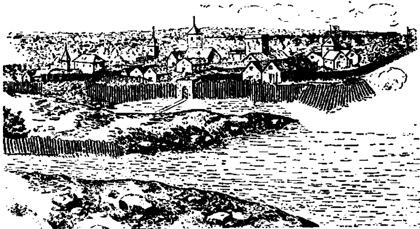
Jamestown vuotena 1622. Ensimmäinen englantilainen siirtola Yhdysvalloissa. Senatkuinen piirroskuva.

sataa vuotta sitte saapuneiden siirtolajälkeläisiä, osa vasta ensimmäis. sukupolven ameriikkalaisia ja loput ulkomailla syntyneitä siirtolaisia. Ja tähän tosiasiiaan — että Amerikan koko kansa ovat siirtolaisia — vedotaankin hyvin usein ulkomaalaisten taholta niiden ristiriitojen selvittelemisessä, joita erittäinkin viimeaikoina on esiintynyt ulkomaalaisten ja ameriikkalaisten "etujen" ja katsantokantojen välillä. Ja ameriikkalainen kapitalismi on viime-