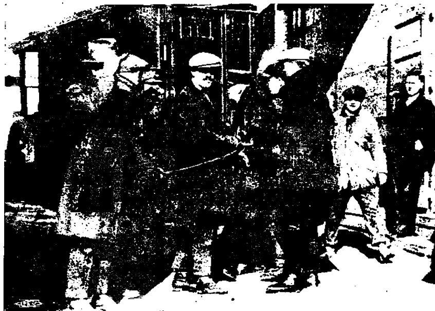
Vangittuja "punasia" käistraudoissa.