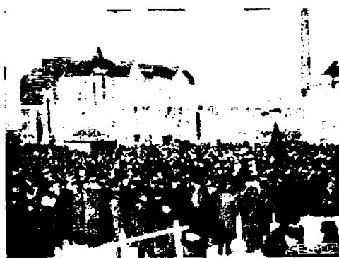
Työväikiä kokoontuu Hakaniemen torille.

Suomessa viime kuukausi on ollut kahdeksantuntisen työpäivän voittokulkua. Itäisestä naapurimaasta, vapauden kehdosta, tulvahti Suomeenkin voimakkaana vaatimus siitä, että Suomessakin, kuten Venäjällä laajassa mitassa oli tapahtunut, työläisten työpäivä olisi rajoitettava kahdeksaksi tunniksi.