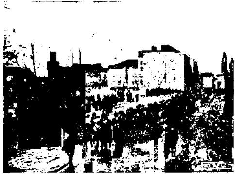
Juhlakulkue: Kämpätöläisten ilto soittokuntineen.

Saavuttamansa vapauden ajan käyttää Suomen työväestö terästääkseen tarmoaan ja tietoisuuttaan yhä uusien oikeuksien hankkimiseksi itselleen.