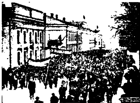
Lakkolaisten kulkue matkalla senaatintorille.