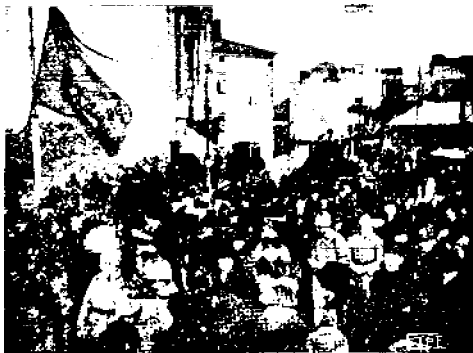
Juhlakulkue: R. Y. Koitto soittokuntineen.