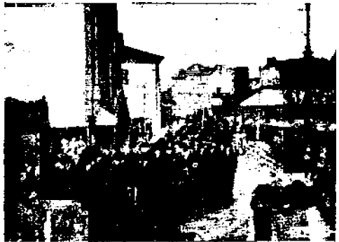
Juhlakulkue: Venäläistä työväkeä ilputineen.