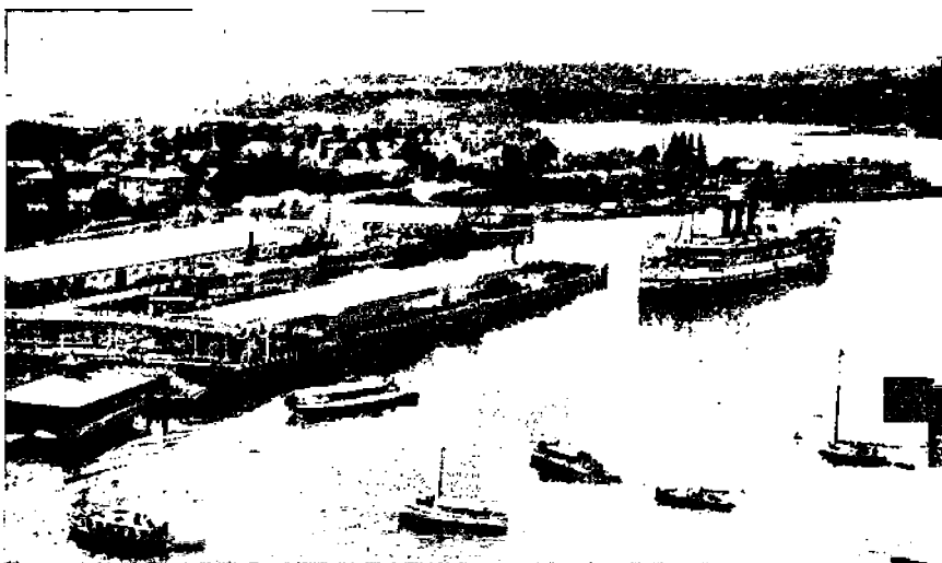
Victorian satama Vancouver-saarella.

Maanviljelyksen kehityksestä antavat hyvän kuvan seuraavat nume-