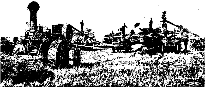
Viljanpuiminen Manitoban vilja-alueella.

nista, Englanti lähetti tai oikeammin Englannista lähti suuret määrät siirtolaisia Yhdysvaltoihin ja vain muutamia harvoja Canadaan.