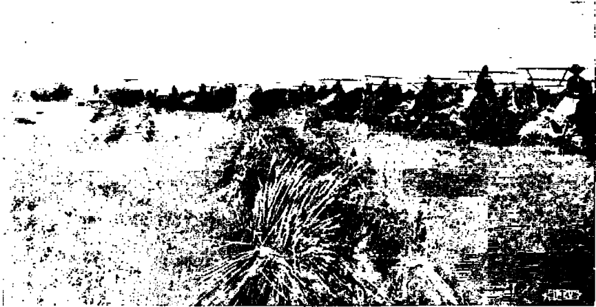
Elonkorjuussa kanadalaisella vehnä- “rensillä” .

lankumousta ja itsehallinnon myöntämistä valtiolliset asiat ja maan kehittymättömyys esti työläisiä siirtymästä Canadaan. He tulivat Yhdysvaltoihin, jossa kapitalismi edistyi jättiläisaskelin. Siirtolaiset,