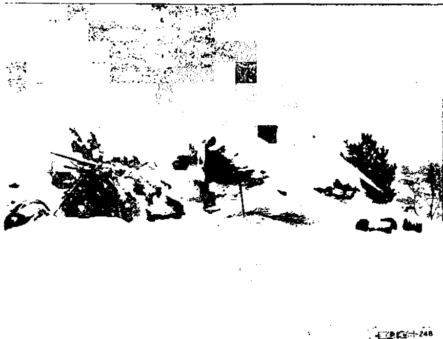
Luonnon luoma kauneus peittää ihmisten luoman kurjuuden

muodostaa näiden suoran vastakohtaan. Puhutaan usein luonnon ja taiteen välisestä vastakkaisuudesta, ja kumminkin on jälkimäinen erottamattomassa yhteydessä edellisen kanssa. Ainoastaan luonnon maaperästä voi taide ammentaa yhä uusia voimia. Luonnolla täytyy luonnollisesti ymmärtää sen kokonaisuutta, siis myöskin ihmis-