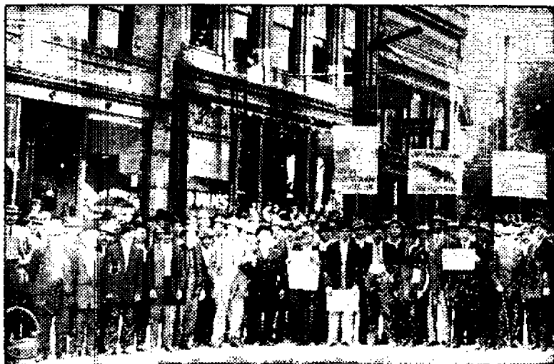
Lakkolaisten mielenosoitus onnettomuustalon edessä. Nuoli osoittaa sitä huonetta, jossa joulujuhlaa vietettiin.

Mutta ei voi olla huomaamatta sitäkään, että lakkolaisten miehe- käs menettely tässä suhteessa on herättänyt myös vaistomaista kunnioitusta, pelon sekaista kunnioitusta porvarien keskuudessa. Kapitalistit tuntevat sisuksissaan, että tässä on nähtävänä jokin uusi mahtava voima, jota vastaan eivät