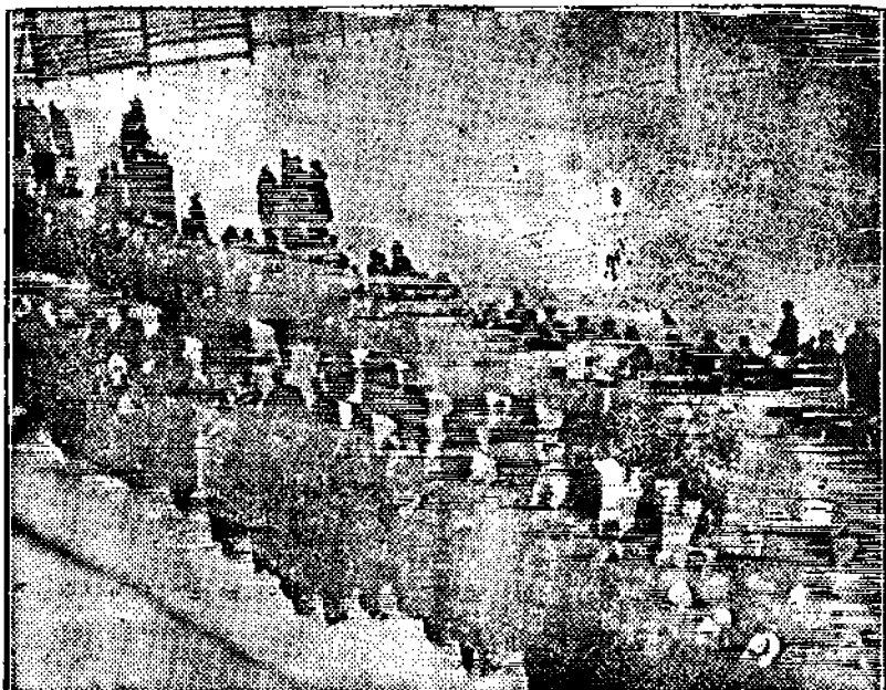
Lasten ruumisarkut kannetaan hautausmaalle.

Niin onkin. Se voima on luokkatietoisuus ja Kuparisaarella ovat luokkarajat selvillä. Ennen lakon alkamista pidettiin Kuparisaarta vanhoillisuuden pesäpaikkana. Siel-