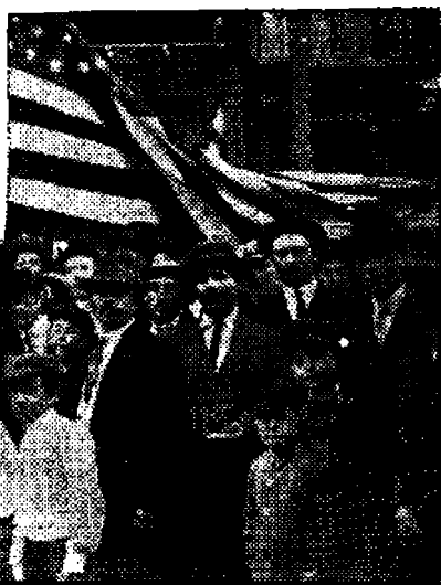
Joukkomurhasta pelastuneita lapsia.

kaikkien muitten elämän perusteenä. Kun kaivosmiehet ristivät käntensä, tulee nälkäkuolema kaikille muille tuolla paikkakunnalla. Ja pikkuporvaristo raivostuneena on vielä hullumpi ja sokcampi kapine kuin konsanaan kapitalismi. Kapi-