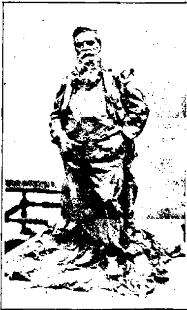
Auguste Rodin, Prinssi Paul Trubetzkoin veistämä

muotoihin; mikään ei saanut olla hänelle vierasta. Samalla hän kuitenkin antoi täyden arvon käytännölliselle puolelle taiteessa; ja voipa melkein sanoa, että Rodin enemmän kuin kukaan muu on nähnyt vaivaa käytännöllisiä harjoituksia suorittaessaan. V. 1875 tutki hän taidetta Italian eri taidekeskuksissa sekä matkusti v. 1877 kautta Ranskan. — Tämän jälkeisestä