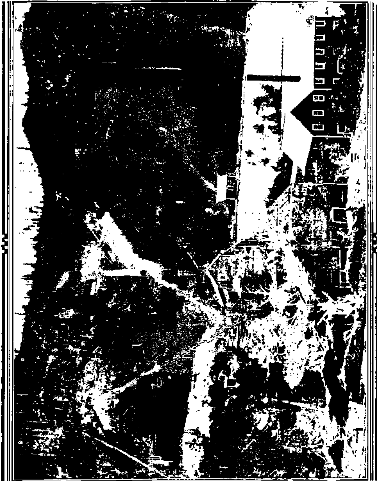
Helena-Frisco malmimurtimo, joka räjähytettiin v. 1892.

kaivannon johtaja, joka oli huonoissa väleissä Bunker Hill yhtiön liikkeenhoitajan kanssa, meni niin pitkälle, että suorastaan