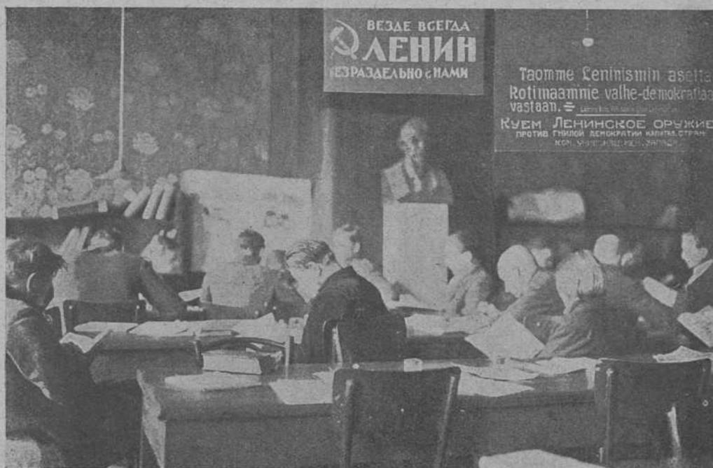
L. V. K. K. Y:n Leninismin kabinetti.

Lännen Vähemmistökansallisuuksien toveri J. Marchlevskin muistolle omistettu Kommunistsen Yliopiston Leningradin osaston kolmannen päästön johdosta.