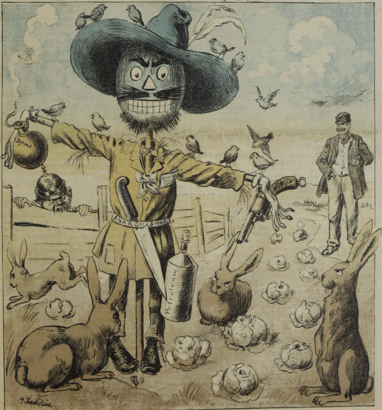
Glümme hinter dem Baun: „Verflucht, das Ding scheint keine Wirkung mehr zu haben.“