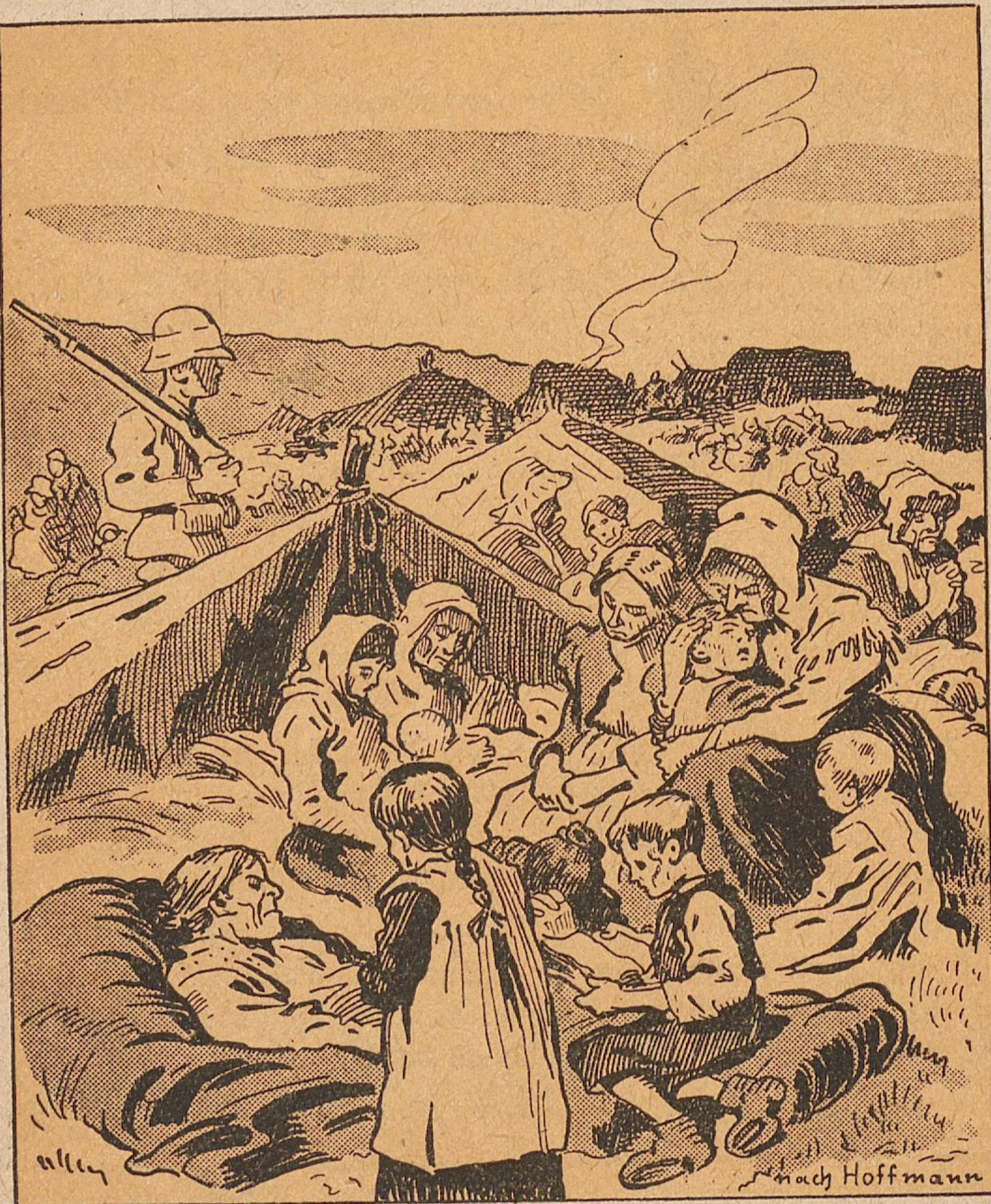
30000 verhungernde Burenfrauen und Kinder.

„Mit dem deutschen Volk, das sich von den Alldeutschen gereinigt und nicht nur in Worten, sondern auch in Taten bewiesen hat, daß es die Missetaten der Vergangenheit bereut und bereit wäre, ein gesundes und friedliches Leben in einem Bund der Nationen zu leben, könnten die Alliierten einen ehrlichen und ehrenhaften Frieden schließen. Aber mit denen, die daran festhalten, daß die nationale Politik auf Macht gegründet sein müsse, und die die Möglichkeit, das Recht zur Grundlage der Weltverhältnisse zu machen, leugnen, kann es keine Verhandlungen geben.“ (Lord Cecil.)