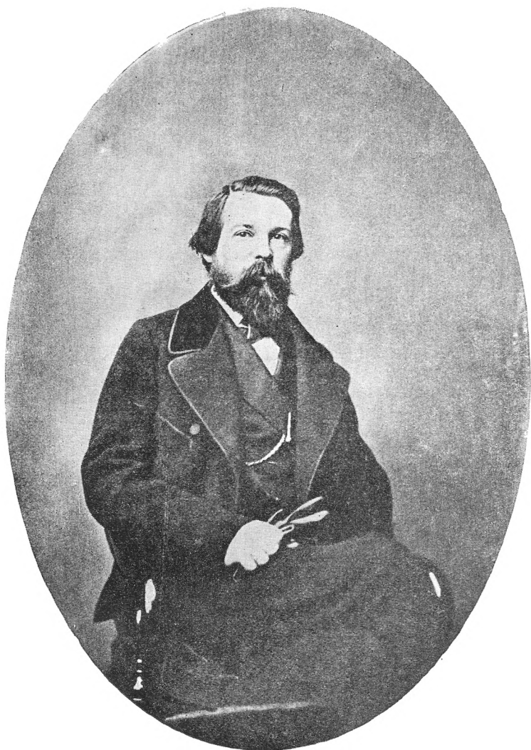
Ф. Энгельс в 1862 г.