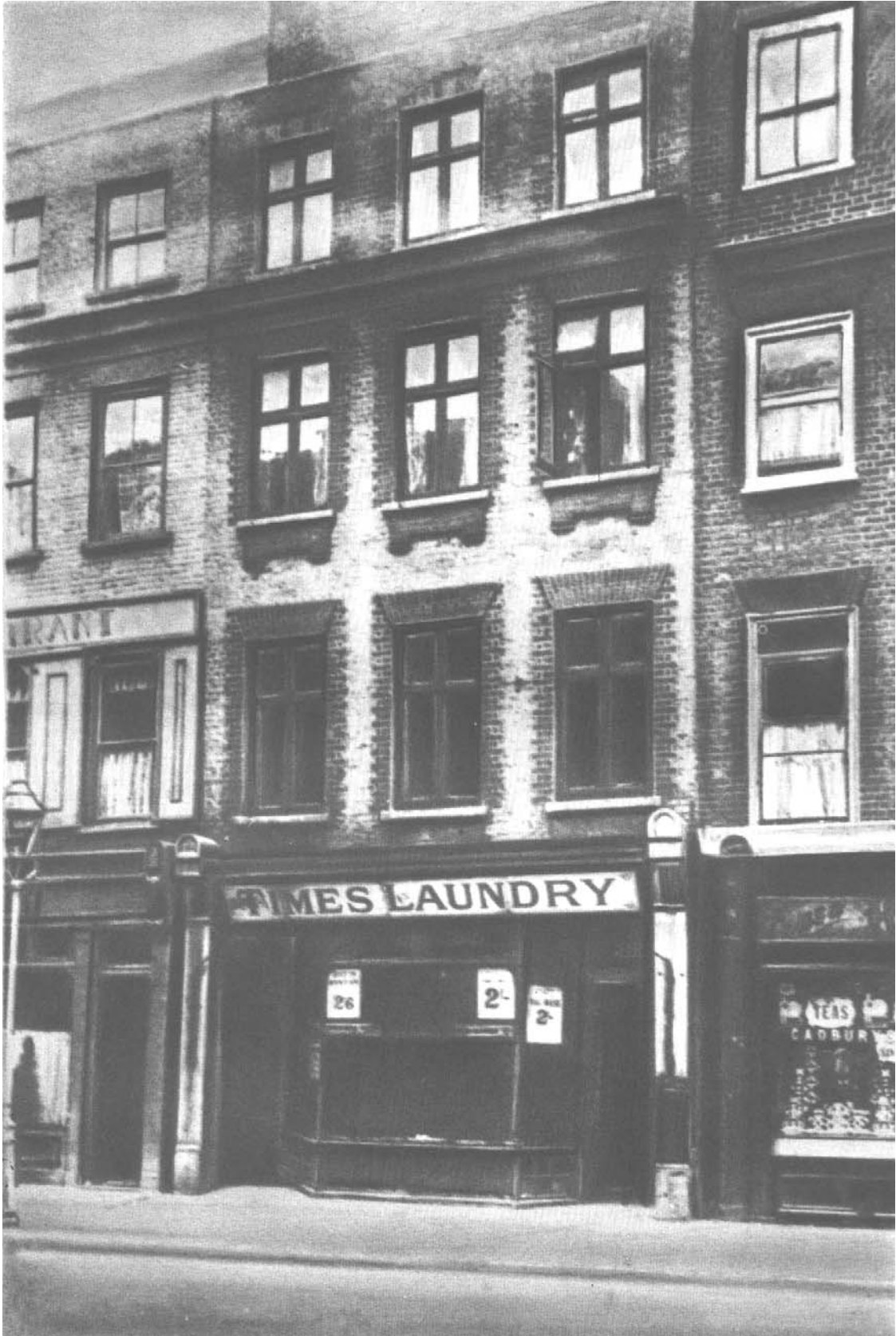
Дом в Лондоне (22, Дин-стрит, Сохо), в котором жил К. Маркс с 1850 по 1856 г.