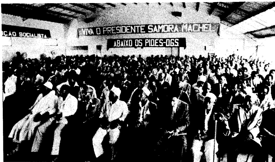
Alguns dos que aqui estão vacilaram.