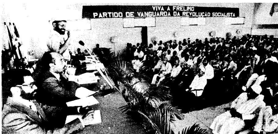
«Os nossos heróis preferem morrer a trair a Organização e a luta do povo» —Presidente Samora Machel.

São estes três exemplos de integridade humana, três exemplos que juntos a muitos outros construíram a independência e o Poder Popular.