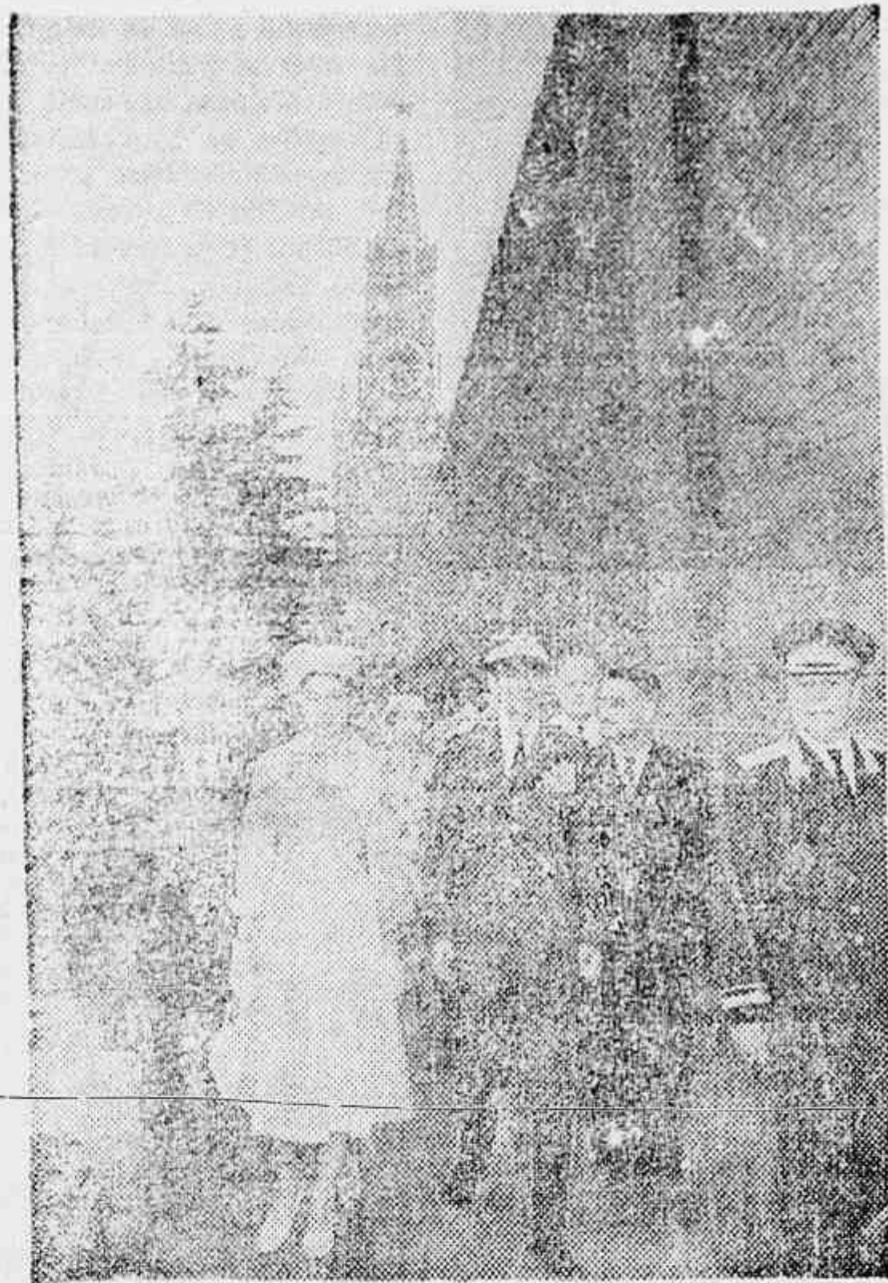
Entre as visitas de chefes de Estados por último feitas à União Soviética, encontra-se a do soberano do Irã, Mohamed Reza Pahlevi, e da rainha Soraiá, sua esposa. Reza Pahlevi e Soraiá, durante mais de uma semana, estiveram em contato com o povo soviético, percorrendo o país. Os reis do Irã aparecem na foto, ao iniciar sua visita ao Kremlin, na Praça Vermelha.

Da Conferência do Panamá nada de bom poderia aguardar nosso povo. Quanto ao sr. Kubitschek, ainda lhe resta, se quizer, fazer das fraquezas forças e recusar-se a novos compromissos antinacionais. Quando menos seria útil que se lembrasse de que os que lhe outorgaram votos e poder, após o 11 de novembro, não ratificarão sua assinatura em compromissos de colonização, nem permitirão que sejam levados à prática.