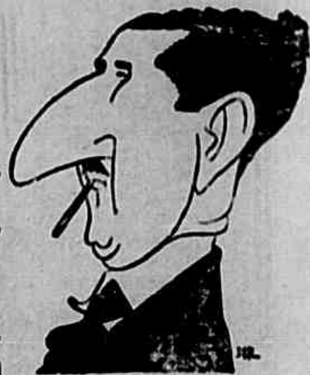
Ademar de Barros

Grandes manifestações anti-imperialistas e anti-guerreiras no Sete de Setembro — Congressos dos Ferroviários, dos têxteis e portuários — Em Baurú, os ferroviários transformaram a parada oficial numa gigantesca manifestação de luta pela paz e pela soberania nacional