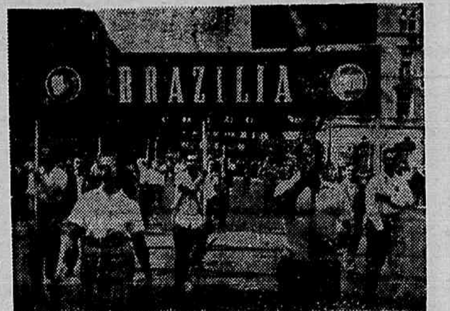
Um aspecto do desfile no Festival da Juventude, onde se vêem os delegados do Brasil.

"No México os povos latino-americanos afirmam mais uma vez seu firme propósito de prosseguirem até a vitória na luta contra o atraso, a miséria e a ignorância em que jazem, pela liberdade, o progresso e a independência de suas pátrias." — LUIZ CARLOS PRESTES.