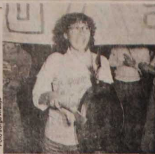
No dia 25, a reafirmação da luta pelas diretas

No dia 25 último, em vários Estados ocorreram mobilizações pelas eleições diretas-já. Embora ainda sem a participação massiva dos comícios que antecederam a votação da emenda Dante de Oliveira, as mobilizações representaram uma retomada da luta. No Rio de Janeiro, no dia 26, foi realizado o Encontro Estadual pelas Diretas-Já.