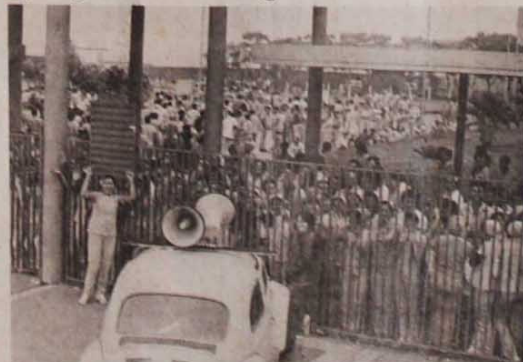
Os patrões não acreditavam, mas os operários ocuparam a fábrica e saíram vitoriosos

Pela primeira vez, em 22 anos de funcionamento, ocorreu uma greve da Alpargatas. Portela conta que "os patrões não acreditavam que uma categoria que nunca fez greve conseguisse fazer uma com tanto êxito". Para ele, a partir desta vitória, será mais fácil negociar na campanha salarial com a empresa. Entre os 52 itens da pauta de reivindicações, há muitos pedidos básicos, como melhor alimentação, mais segurança e melhores