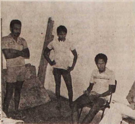
Os três jagunços presos denunciam que o grileiro comandou a matança