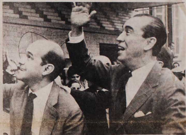
Tancredo e Juscelino: participação mineira na luta pelo poder central do país

Assim, só pode pensar que os comunistas caem na jogada suja de abandonar o povo pelas negociações do regime quem está muito mal informado ou então quem, de má fé, pretende informar erradamente a opinião pública.