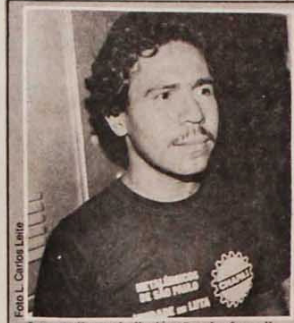
Juruna: "nem sindicalizações eles fazem"