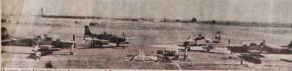
Quatro aviões Tucano foram descobertos no aeroporto de Roraima quando viajavam secretamente para Honduras.