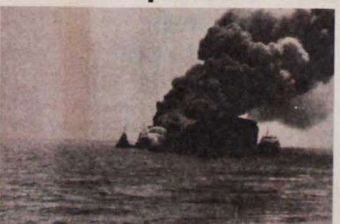
Mas um navio atingido por mísseis no Golfo Pérsico: a rota do petróleo ameaçada

Com efeito, é enorme o poderio bélico norte-americano na região do Golfo no em suas cercanias, o que só comprova o caráter agressivo e aventureiro desse imperialismo. Somente no Estreito de Ormuz, diante do Sultanato de Omã, traflagam permanentemente 9 navios de guerra norte-americanos. Além disso, os EUA possuem, também em Omã, uma base de radar e um aeroporto. Em bases militares da Arábia Saudita encontram-se 4 aviões AWACS da Força Aérea norte-americana. Se se acrescentar a isso as frotas francesa e britânica nas águas do Oceano Índico, tem-se a medida da concentração de forças militares do imperialismo norte-americano e de seus aliados na região conflagrada.