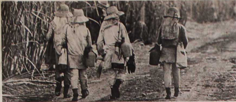
Os trabalhadores rurais de Campo. Acima caminham mais de uma hora a pé porque o patrão não oferece condução