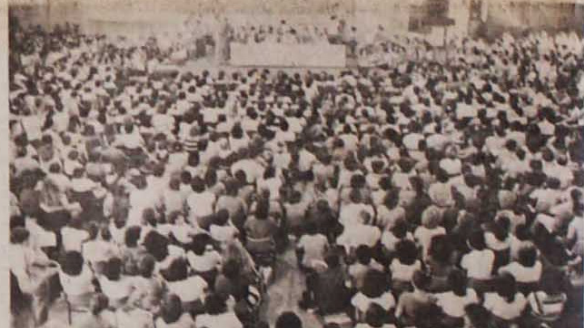
Reunidos em assembleia os professores paulistas decidiram somar forças com o funcionalismo