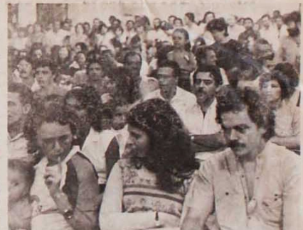
Os metalúrgicos lotaram a sede do Sindicato para lançar a Chapa 1

Para fazer frente a esta situação os metalúrgicos de BH e Contagem necessitam de um sindicato combativo, forte e