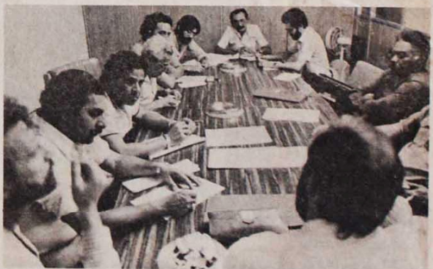
Reunidos em São Paulo, dirigentes da Conclat e CUT definem os rumos da luta sindical

Encontro Nacional, em Curitiba, propõe "retomada das mobilizações populares" pela conquista das diretas. Pág. 3