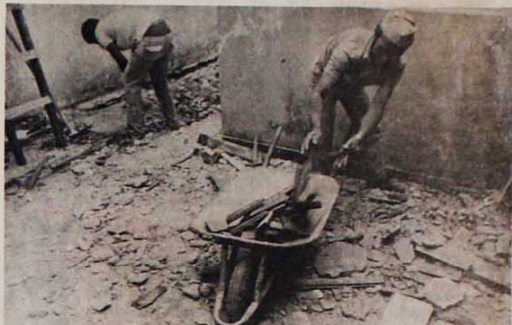
Com o apoio vindo de todo o país, a Tribuna Operária está sendo reconstruída