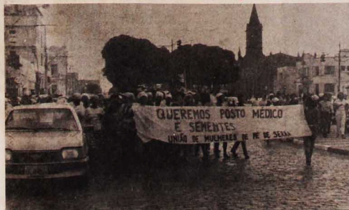
Mulheres da terra natal de Maria Quitéria honraram a tradição da heroína da Independência

Uma fato incomum movimento a cidade baiana de Feira de Santana na segunda-feira, dia 28: cerca de 300 mulheres dirigiram-se em passeata à Prefeitura, aos gritos de "Sementes já!" e "Um, dois, três, quatro, cinco, mil, queremos posto médico e semente pro plantio!" Entregaram ao prefeito, do PDS, um abaixo-assinado exigindo a distribuição imediata e sem apadrinhamento das sementes de milho e feijão, além da instalação de um posto médico no povoado de Pé de Serra.