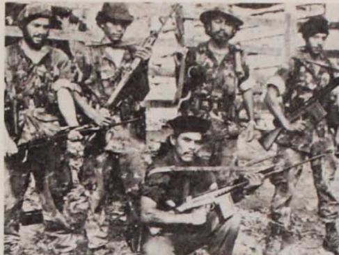
Bando de somozistas financiados pela CIA num acampamento em Honduras

Em fins de abril o coordenador da junta do governo nicaraguense, Daniel Ortega, afirmava que "a Nicarágua está cercada militarmente pelos Estados Unidos, que utilizam Honduras e Costa Rica como base para as ações armadas anti-sandini-