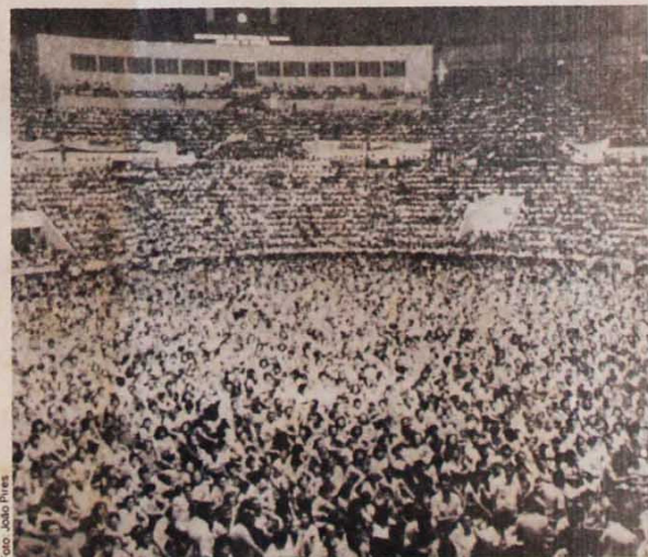
Cerca de 20 mil professores decidiram no Ibirapuera encerrar a greve

vitória parcial e que mantivemos o magistério unido". De fato, na assembleia do Morumbi, com mais de 100 mil pessoas presentes, com som deficiente, era realmente impossível discutir as diferentes propostas. E a direção do movi-