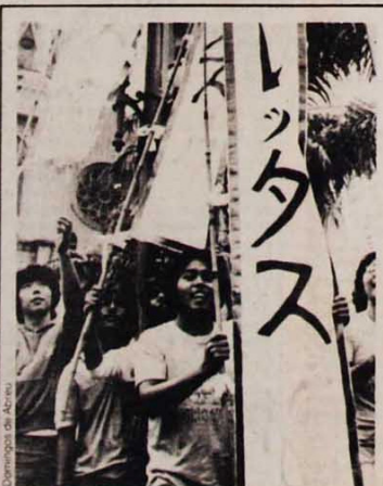
Um estandarte de batalha

Bonecos por sinal não faltaram. No Largo de São Francisco, um casal de 4 metros de altura sambava pelas diretas. No Anhangabaú, um velho desdentado, confeccionado em pano, trazia no peito um cartaz: "1964-1984; nem praça de mãe dura tanto". Três enormes bonecos vestidos de presidentes, Figueiredo, Maluf e Delfim, trazidos pela Tribuna Operária para serem expostos à excreção popular, terminaram destruídos pela multidão depois que o comício começou. A cabeça de Maluf ainda ficou uns bons minutos sendo jogada de um lado para outro, além de sucumbir no meio da multidão.