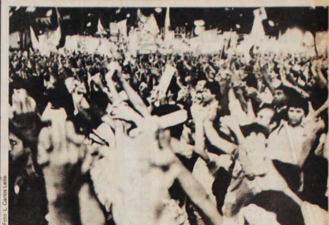
"Sinfonia das Diretas": o maior coro do planeta

Quanto a candidatos, Sócrates é tachativo: "O grande candidato é o povo brasileiro. Não interessa quem vai chegar lá. Ele vai ter que governar de acordo com a vontade e opção do nosso povo".