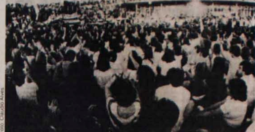
As caravanas de mulheres concentraram-se na rampa do Congresso e realizaram o ato

O governador do Rio de Janeiro, Leonel Brizola, lembrou que "esta é uma campanha que não tem dono. O povo anseia por democracia, onde todas as ideias políticas possam se expressar livremente". O presidente nacional do PMDB, deputado Ulysses Guimarães, destacou que as eleições diretas constituem um anseio nacional de todo um povo e significa o reencontro da Nação com a liberdade e o patriotismo". (da sucursal)