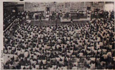
Os professores mineiros em greve: um direito legítimo

Surpresa, porque o governo que hoje dirige o nosso Estado, eleito pelo povo mineiro na base de compromissos democráticos e de oposição ao regime militar, utiliza os mesmos surtos argumentos reacionários