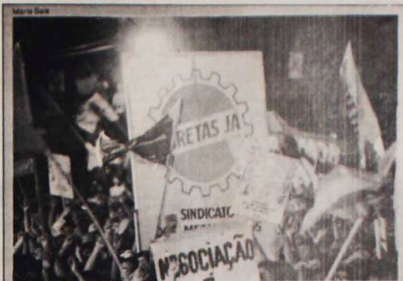
Estandartes, "piralitos", camisetas: a presença organizada dos metalúrgicos no comício