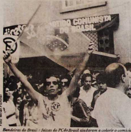
Bandeiras do Brasil e faixas do PC do Brasil ajudaram a colorir o comício

Mais de uma dezena de bandeiras e estandartes do PC do B foi afixada e empunhada pelo povo, imprimindo um colorido maior ao grande comício.