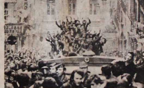
A "Revolução dos Cravos" traz importantes lições para o proletariado e os povos

A explosão revolucionária desembocou no "Verão Quente" de 1975.