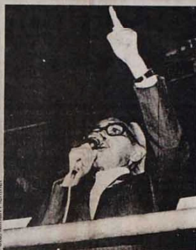
Amazonas: "Basta de tutela militar"

Falando do entreguismo e da corrupção que infestam o governo, Amazonas disse que estamos assistindo à "degradação completa do regime que chegou ao fim, pois já passou a época em que alguém podia falar com as armas para impor sua opinião. Hoje a opinião popular se impõe nas praças públicas". O ex-eputado constituinte destacou "a necessidade da mais ampla unidade e da or-