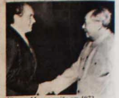
Nixon e Mao: a união em 1972

O governo chinês anunciou que até o final de 1983 as firmas norte-americanas investiram 696 milhões de dólares na China e criaram 21 sociedades mistas sino-americanas. No final deste mês, o presidente ianque, Ronald Reagan, visitará Pequim, para entabular novas negociações e acordos com os social-imperialistas chineses.