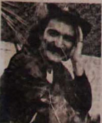
Belchior defendeu discurso da UNE

O comício realizado no dia 12 de abril em Goiânia, que contou com mais de 300 mil pessoas (ao fecharmos a edição passada, antes do término do comício, havia 200 mil pessoas na rua) foi um grande sucesso. Apesar disso, houve pontos negativos: a discriminação dos movimentos populares e partidos que lutam pela legalidade, se acumulando na falta de democracia na escolha dos oradores, na retirada de bandeiras e faixas.