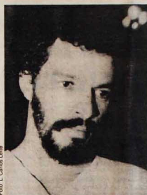
"O candidato é o povo"

Um grupo de nisseis e sanseis (filhos e netos de japoneses) levou para a avenida estandartes na língua de seus antepassados, e todo mundo entendia o que estava escrito: diretas já. Um deles explicou que, no Japão, era costume os cavaleiros levarem bandeiras daquele gênero antes de começar uma batalha. Outro citou seu pai, japonês e veterano de duas guerras, como exemplo de que todo mundo quer as diretas.