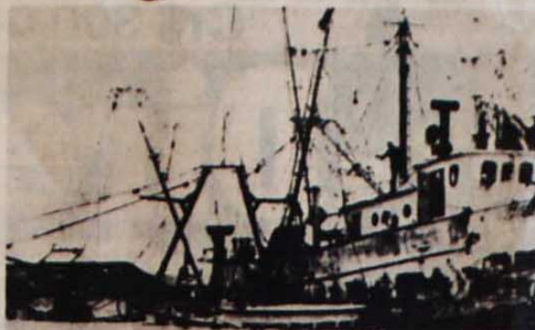
Um pesqueiro vai a pique no porto Corinto, por causa da minas da CIA

A Nicarágua está sob cerco militar. A partir de bases militares em Costa Rica e Honduras, utilizando os mercenários das organizações contra-revolucionárias Arde e FDN, o governo Reagan está atacando o país de Sandino. Os portos no Atlântico e no Pacífico foram minados pela CIA, e o governo nicaraguense apelou para a intermediação da Corte Internacional da Justiça, da ONU.