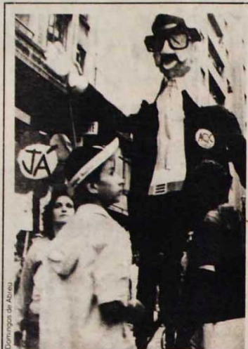
Teotônio Vilela: presente!

A organização popular, a presença ativa das entidades, a criatividade, a alegria, a garra também bateram recordes históricos. E acima de tudo a disposição unânime daquele mar de gente, de acabar com o reinado dos generais e dar um rumo novo ao Brasil. Depois do 16 de abril em São Paulo, do 10 de abril no Rio, o país já não é o mesmo. O povo na rua feriu de morte o regime militar. Algumas cenas da manifestação atestam as dimensões desta reviravolta.