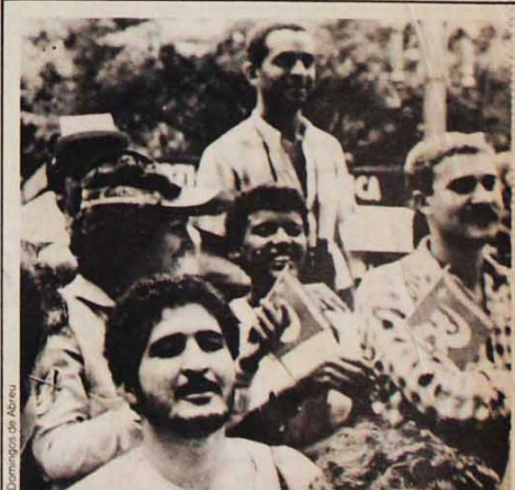
Alta procura de bandeiras do PC do B

Vestindo camisetas azuis com o emblema do Sindicato, carregando faixas com os nomes das fábricas e "pirulitos" com o símbolo das diretas, os metalúrgicos da capital paulista evidenciaram sua organização e garra na luta pelas eleições diretas e pelo fim do regime militar. "Chora Figueiredo, Figueiredo chora, que está chegando a sua hora", cantavam os operários da primeira passeata de metalúrgicos que chegou a praça da Sé, recebida com grande vibração pelos manifestantes que viam os operários desfilerem organizados. "Não dá mais pra aguentar o Delfim roubando os nossos salários; o Passarinho dando uma de abutre contra os aposentados; o Figueiredo falando para as paredes, como se estivesse caducando. Este governo não tem perdão", afirma um operário da Zona Oeste. Sem dúvida a entidade sindical dos metalúrgicos jogou peso na mobilização da gigantesca categoria, com comícios nas fábricas, panfletagens e cerca de 30 ônibus alugados. Segundo seus cálculos, mais de 5 mil trabalhadores da base participaram de forma organizada do comício, além de tantos outros que vieram por conta própria.