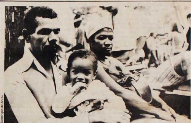
Para muitos, foi uma manifestação em família