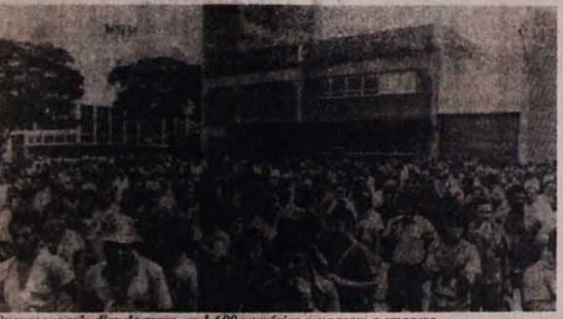
Durante os três dias de greve, os 1.600 operários ocuparam a empresa