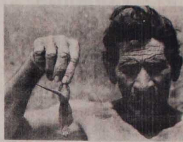
No sertão da Bahia os lavradores já comem catangos