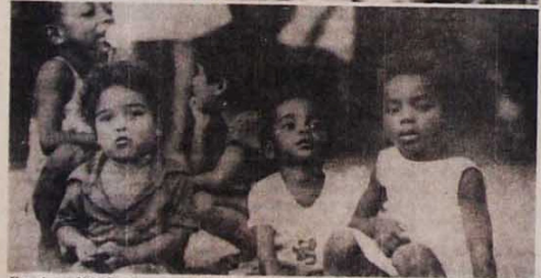
Em cima, Vila Socó, um cenário de guerra atômica: destruição e morte. Embaixo, crianças sobreviventes da tragédia. Como viverão agora?