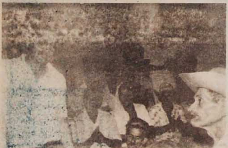
Em interior de Goiás, um em cada dez habitantes foi ao comício