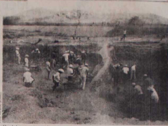
Flageioles constroem açudes nas terras dos grandes fazendeiros e ficam sem água

No último dia 28, os 2 mil metalúrgicos da Brosol em Santo André (SP), pararam imediatamente a empresa, reivindicando estabilidade de seis meses, emprego, aumento de 15% no salário e reconhecimento da comissão de fábrica. No início, parecia-se que só os homens iriam aderir à greve. Mas logo após a madrugada as mulheres passaram a liderar o movimento, puxando inclusive um arrastão para parar outros setores. Após desligarem as máquinas, os operários concentraram-se no pátio da empresa e depois saíram em passeata exigindo eleições diretas para presidente da República. No final da tarde a greve foi estendida sem nenhuma conquista imediata, mas o ânimo dos grevistas era grande.