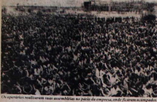
Os operários realizaram suas assembleias no pátio da empresa, onde ficaram acampados