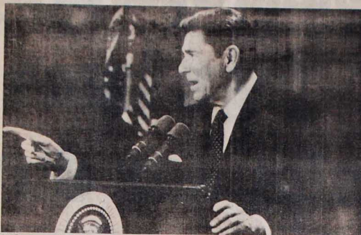
Seja Reagan ou um "artista" qualquer, quem aponta os rumos são os grandes monopólios

Para tentar manter as aparências, o governo norte-americano passou uma lei em 1971, limitando em US$ 25 mil (Cr$ 32 milhões) as contribuições individuais para candidatos à Presidência ou a vagas no Congresso. Isto só torna um pouco mais complexo o processo de apoio do grande capital aos candidatos, que em vez de receberem tudo numa grande bofetada, têm de dividir os dólares entre diversos "contribuintes".