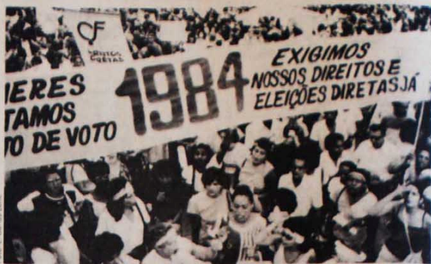
Na passeata de São Paulo, em 24 de fevereiro, as mulheres exigiram direitos e diretas.

Mas nem tudo é miséria na Vila Socó. Eles receberam a imediata solidariedade dos trabalhadores, vanguardada pelos operários de Cubatão. Momentos depois do incêndio, 40 trabalhadores da Cosipa saíram do trabalho noturno e foram direto doar sangue para os feridos. Em seguida, os 6 mil operários da empresa doaram os pães, leite e laranjas de suas refeições para seus companheiros da Vila Socó. (Carlos Pompe)