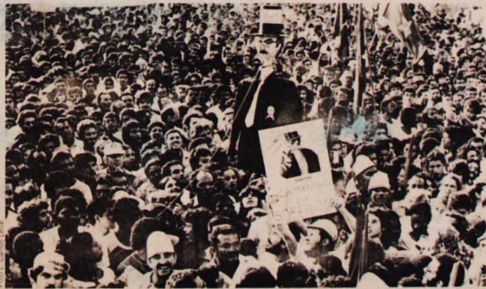
Osasco, dia 19, 20 mil na praça: o veto dos ministros militares só fez aumentar o tamanho das comícios

be-se que estes senhores estão apertados entre a pressão das multidões e a tentação de vender-se a peso de ouro no leilão dos "presidenciais". Até agora parece que a maioria, pragmática, prefere o ouro. Mas muita água ainda vai correr até o dia da votação da emenda — e depois dele, até 15 de janeiro de 1985, quando pelas regras atuais seria eleito o sucessor de Figueiredo. Daqui para lá, o portentoso movimento pelas diretas tem todas as condições de alcançar a vitória. (Bernardo Joffily)