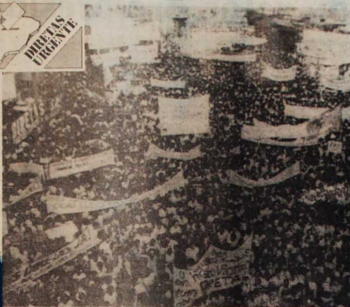
Praca da Rodoviária, Belo Horizonte, 24 de fevereiro: um desafio mais contundente que qualquer discurso

São o imponente total de quase 2 milhões de manifestantes, numa época em geral "morta", espremida entre o Ano-Novo e o Carnaval, atesta que algo de muito grande e importante acontece. Ao encher as praças, o povo não se limita a exigir um direito, a travar uma batalha política. Escreve uma página de destaque na história do Brasil. A campanha tem, no entanto, outros aspectos que merecem atenção. É o conjunto deles que ex-