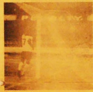
Estádio vazio não comemora vitória

T.O. — Você gostaria de dizer mais alguma coisa? Dominginhos — Só uma ressalva: Peço maior respeito à música popular brasileira. Que isso seja uma coisa normal. (Carlos Pompe)