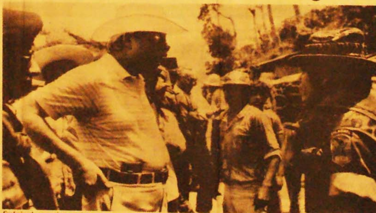
Embaixador americano orienta os fascistas em El Salvador

No último mês a CIA intensificou os ataques dos grupos somostas e traidores à Nicarágua. O próprio dirigente do principal grupo contra-revolucionário, Edgard Chamorro, coronel da Frente Democrática Nicaraguense (FDN), admitiu que o objetivo é estabelecer "um governo" em alguma parte do território da Nicarágua nos próximos três meses. A partir daí, os somostas poderiam solicitar "legalmente" a intervenção da Condeca ou mesmo invocar a ajuda do Tratado Interamericano de Assistência Recíproca (TIAR), junto à Organização dos Estados Americanos. E se houver algum contratem-