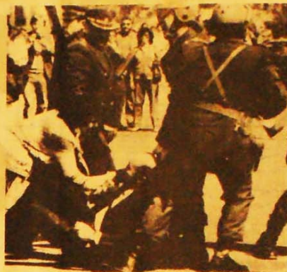
O PC(AP) propõe o castigo dos assassinos e torturadores

Mas existem duas grandes diferenças. Primeiro é que desta vez os militares chegaram a um auge de desmoralização. Comprometeram-se e foram cabalmente responsabilizados pelas massas como torturadores e assassinos de democratas e lutadores do povo. E envolveram-se na desastrosa aventura das Malvinas. Em segundo lugar, as massas viveram a experiência do golpe e de um tenebroso governo fascista, que além de custar milhares de vidas, liquidou com a economia do país e levou o povo argentino a uma situação de calamidade, como nunca antes acontecera na sua história. Embora ainda não existia no país uma forte vanguarda marxista-leninista, a crise criou condições amplamente favoráveis a um avanço do movimento revolucionário no país.