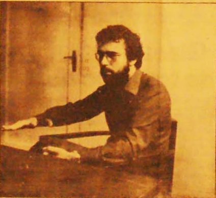
Pai: "Não vamos conciliar com o regime, nem importar a divisão"

Privada de diretoria, administrada internamente por um colegiado que não contou sequer com os votos de todo o Bloco petista, a entidade máxima dos universitários paulistas passa a viver em compasso de espera até as eleições diretas de março de 1984.