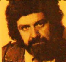
Trigo: "vi a fúria de um povo"

O delegado também contribuiu. Numa falta de competência ele manteve durante quatro horas os suspeitos e não teve o "desconfiômetro" de tirá-los da cidade onde existia a síndrome de vingança. O pessoal começou a se aglomerar na porta da Dele-