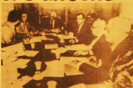
Participantes do "Grupo dos 11" do PDS reunidos no Rio

O documento pouco tem a ver com o conjunto do PDS. Foi na verdade concebido por técnicos da Secretaria do Planejamento, da Fazenda, e com forte influência de Roberto Campos, um dos representantes diretos do imperialismo norte-americano no Brasil.