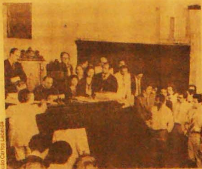
O juiz anuncia a condenação dos assassinos do procurador