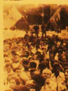
A bandeira do PC do B, na Praça da Sé

Além da Comissão Nacional pela Legalização do PC do Brasil, em São Paulo e por todo o país já se formam comissões locais pela legalidade. E este movimento tem sido bem recebido entre os verdadeiros democratas.