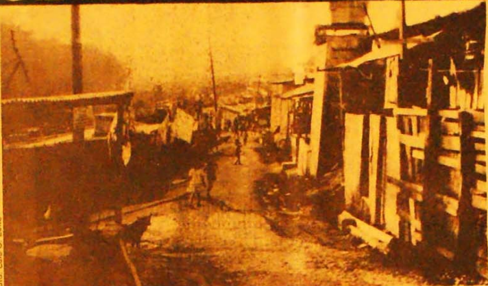
Nas vielas do Jardim Esmeralda as crianças brincam no meio dos esgotos a céu aberto

Operários morando na prefeitura hoje existem aproximadamente 83 mil favelados, um aumento de 20 mil só no último ano. E quem está indo para as favelas