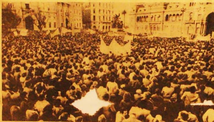
As massas argentinas aprenderam com a dura experiência do fascismo.