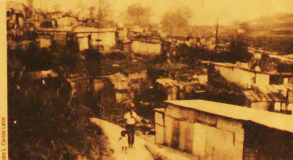
Na favela do Jardim Esmeralda já não tem mais lugar para fazer barracos.

Deputado conta como foi a revolta popular, na página 8.