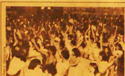
Plenária do Congresso: heveira vantagem para o Bloco petista

O mesmo exclusivismo levou a estruturação da central petista na região, apesar do alerta que foi feito pelo Sindicato dos Bancários do ABC numa nota oficial que lembrava: "Insistir na formação de uma CUT regional é possibilitar que se crie outra inter-sindical na região. Será que está divisão interessa a classe operária e contribui para o avanço da nossa luta?" Os bancários propunham a convocação de um congresso de unificação do movimento sindical na região, mas a proposta foi derrotada. A central foi "fundada" e novamente se notou a briga sem escrúpulos na escolha da sua direção. (do correspondente no ABC Paulista).