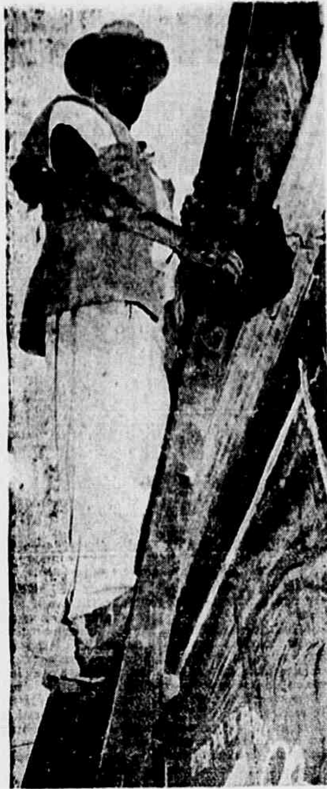
Na Light, os trabalhadores vivem assim. O trabalho é duro em todos os setores. Mas estes homens que são explorados miseravelmente, não terão o abono de Natal.