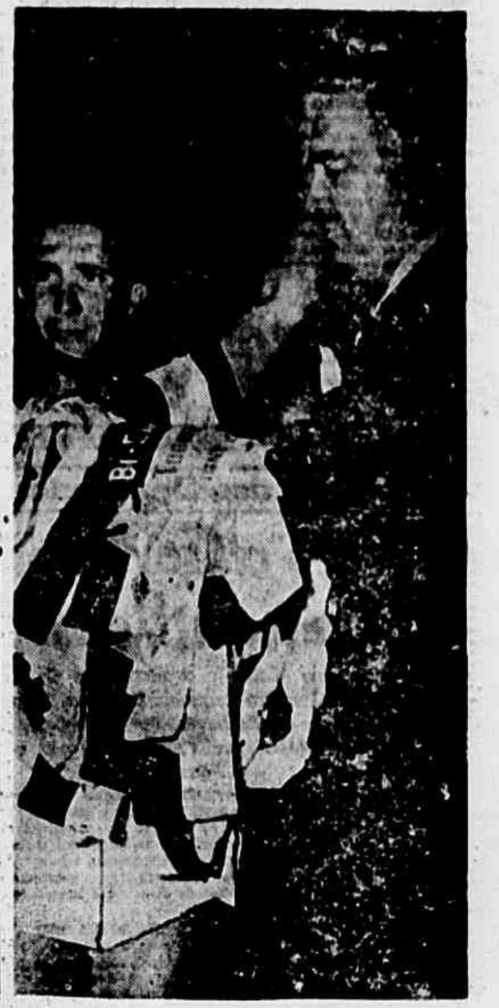
Uma cerimônia que o Vasco deseja repetir domingo: a entrega solene das faixas de campeão aos seus defensores.