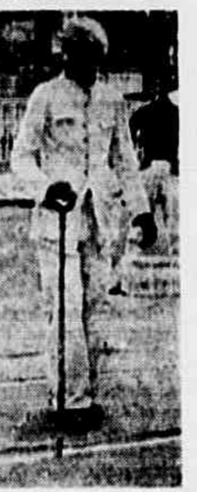
Este chaveiro concorre com seu trabalho para que a Light acumule seus lucros fabulosos. Mas não terá abono de Natal...

Na estação de carros da Praça da Bandeira, os condutores, à nossa chegada, comentavam