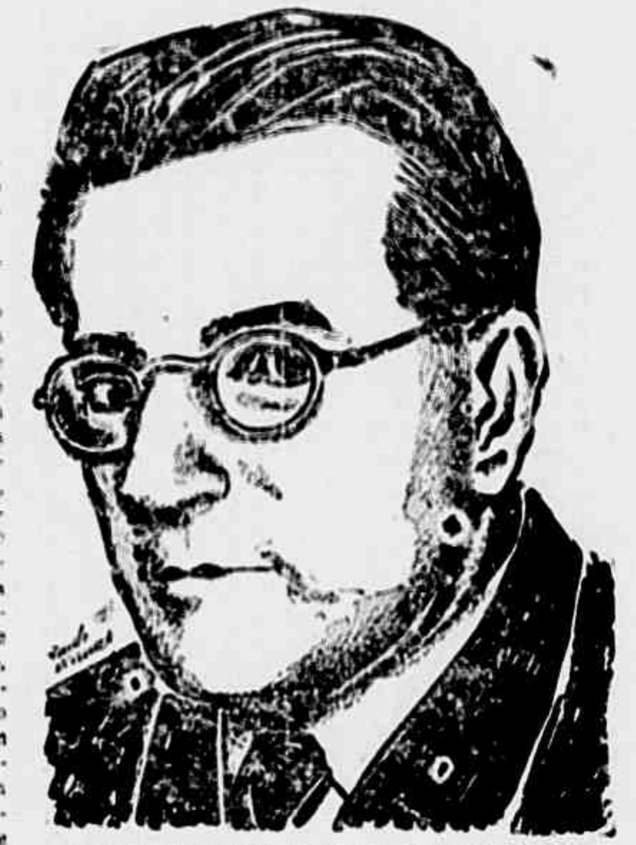
Togliatti, líder da classe operária e do povo italiano

modos a qualquer tentativa de retorno à reação e ao fascismo". A luta pelos Conselhos de Gestão tornou-se agora o ponto nevrálgico da luta da classe operária por uma democracia melhor na Itália. O Congresso de Milão, no qual se reuniram mais de 7.000 delegados de todas as empresas industriais do país, constituiu um espetáculo formidável. Só a participação dos