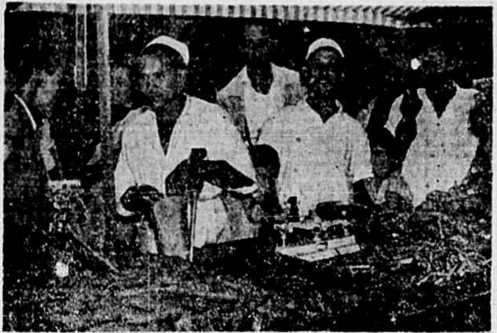
O povo já não pode conter a sua revolta diante do estado de miséria a que foi lançado pela ditadura. Os barraqueiros também sofrem as consequências da miséria geral.

ANO III — N. 782 — SEXTA-FEIRA, 5 DE DEZEMBRO DE 1947