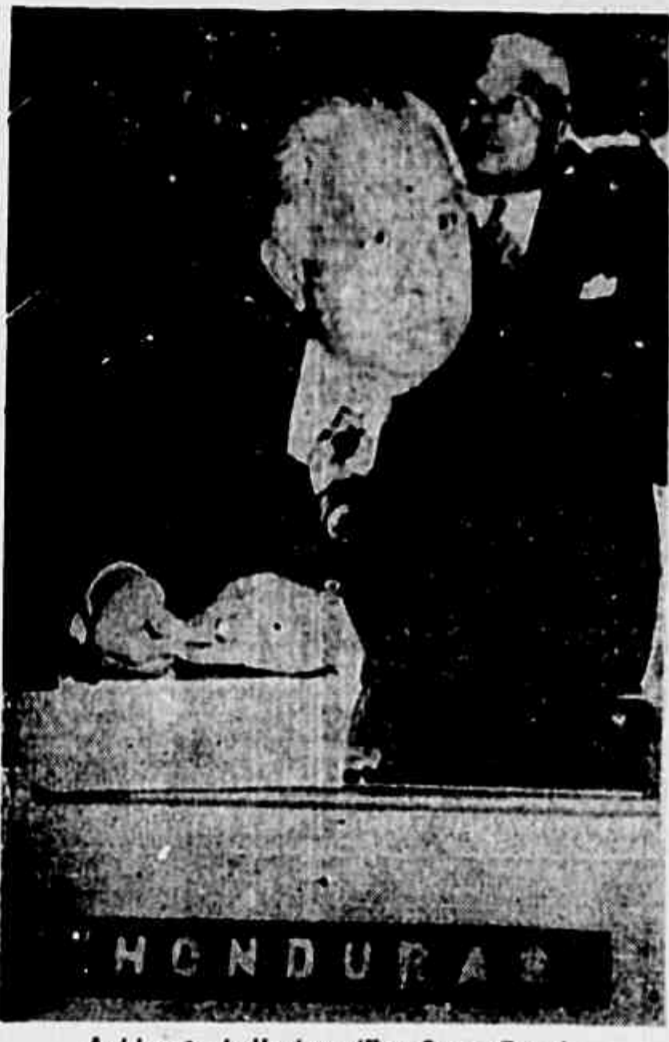
A delegação da Honduras

Novas manifestações, inclusive do chanceler brasileiro, no sentido de subordinar as organizações regionais ao poder único da O.N.U. — Começarão a funcionar as comissões — Falam os srs. Raul Fernandes e os chefes das delegações do Urugual, de Honduras, da Argentina e do Chile