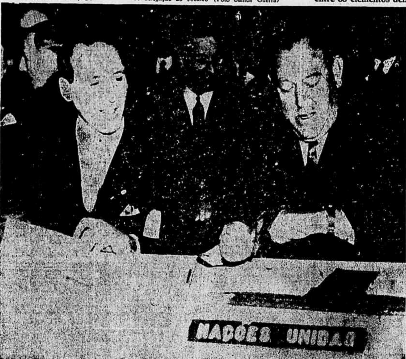
O Secretário Geral da ONU, sr. Trygve Lie, manteve amistosa palestra com o chefe da delegação argentina, chanceler Bramuglia, de que a gravura acima é um esplêndido flagrante.