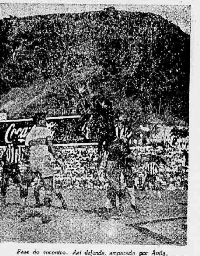
Fase do encontro. Art. defende, amparado por Avila. NOTICIÁRIO NA 1.ª PÁGINA

PETROPOLIS, 16 (Dos enviados especiais da TRIBUNA POPULAR) — O sorteio localizou a delegação norte-americana ao lado da do Haiti na mesa da Conferência. Os delegados haitianos, que são todos negros, acham-se assim (Conclui na 2.ª pág.)