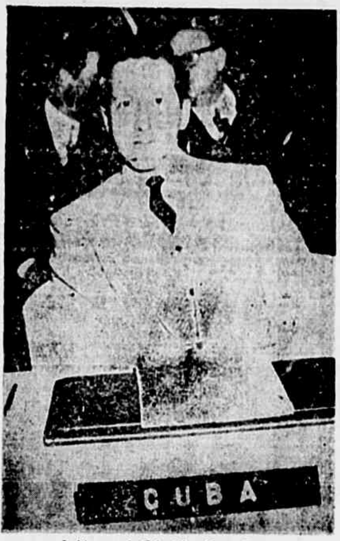
A delegação de Cuba

enviados especiais da TRIBUNA POPULAR) — Falando ao tomar posse do cargo de presidente da Conferência, o chanceler Raul Fernandes teve oportunidade de dizer que "a segurança dos Estados é o instrumento da segurança dos indivíduos e que, em última análise, os convênios que vamos estruturar constituem apenas a pedra angular de construções mais vastas para afiançar a defesa da pessoa humana nos seus direitos fundamentais de liberdade, justiça e bem estar". O sr. Raul Fernandes situa nos seguintes termos a posição das nações americanas em face da ONU: "É certo que, seja qual for a nossa diligência, estamos sujeitos, na instância das sanções, ao controle do Conselho de Segurança das Nações Unidas onde tem assento e voto Estados em maioria extra-continental. Este é o preço