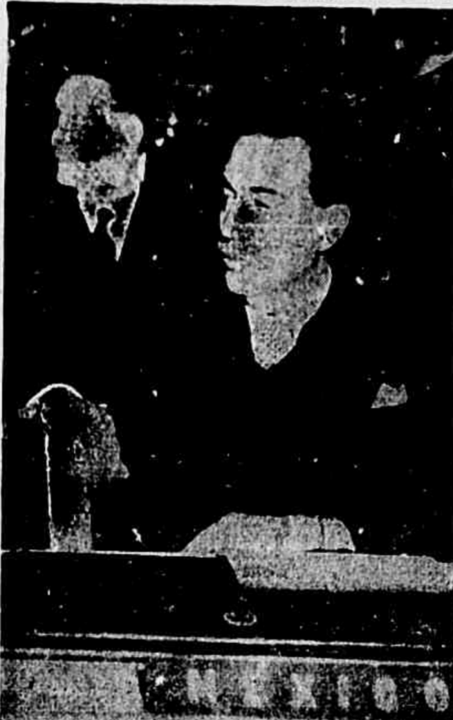
A delegação do México