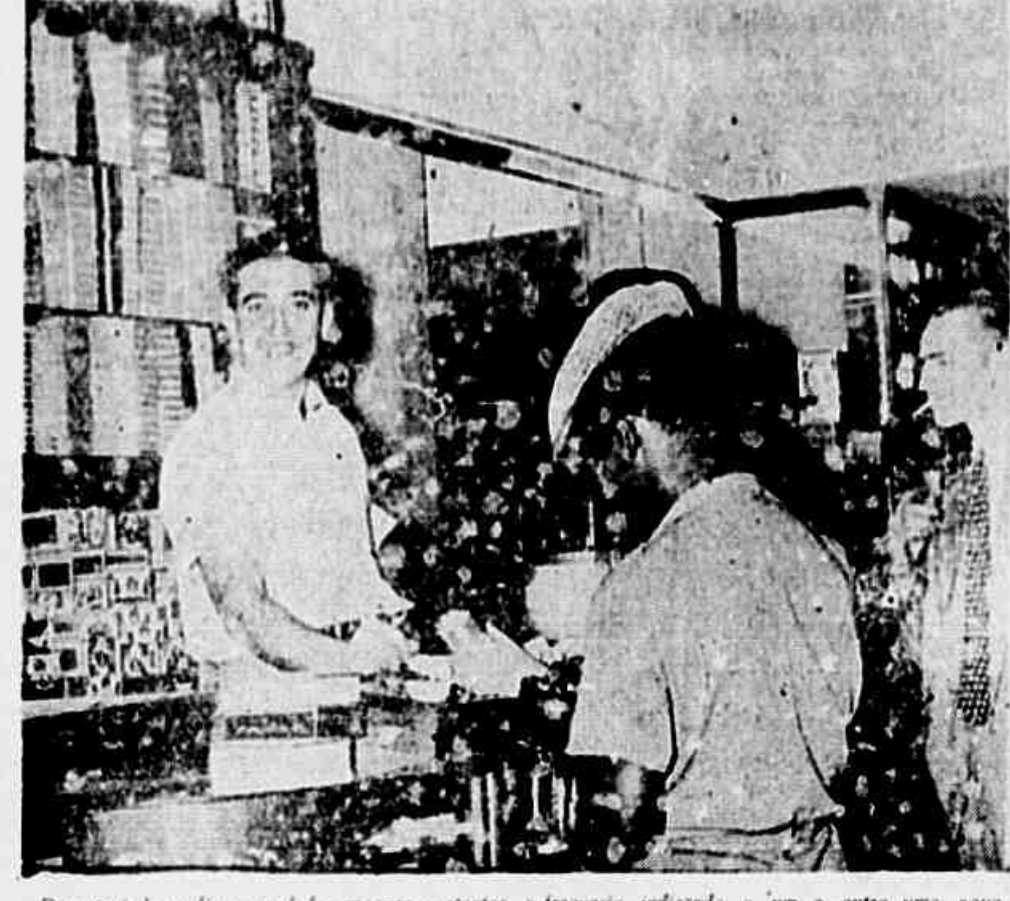
Durante todo o dia o vendedor procura contentar a freguesia indicando a um e outro uma nova marca, porque muitos os cigarros mais procurados.

ANO III * N.º 658 * TERÇA-FEIRA, 5 DE AGOSTO DE 1947