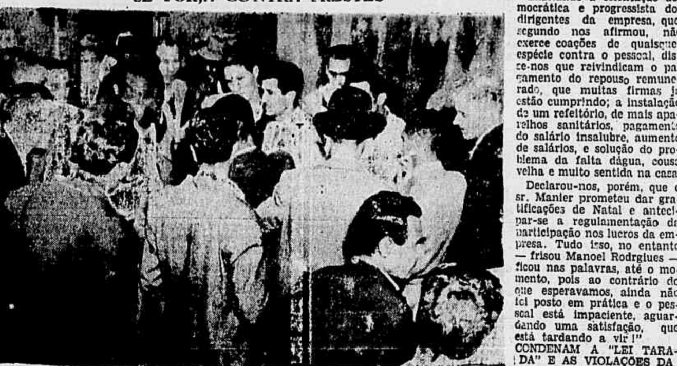
Os marceneiros da Casa Leandro Martins quando chegaram ao nosso repórter, na porta da grande fábrica de móveis

ORGANIZAM-SE OS OPERÁRIOS DA FABRICA DE MOVEIS LEANDRO MARTINS S/A. — AGUARDAM ANSIOSOS O JULGAMENTO DO DISSÍDIO COLETIVO — ENERGICOS PROTESTOS CONTRA A LEI TARADA E CONTRA O PROCESSO QUE SE FORJA CONTRA PRESTES