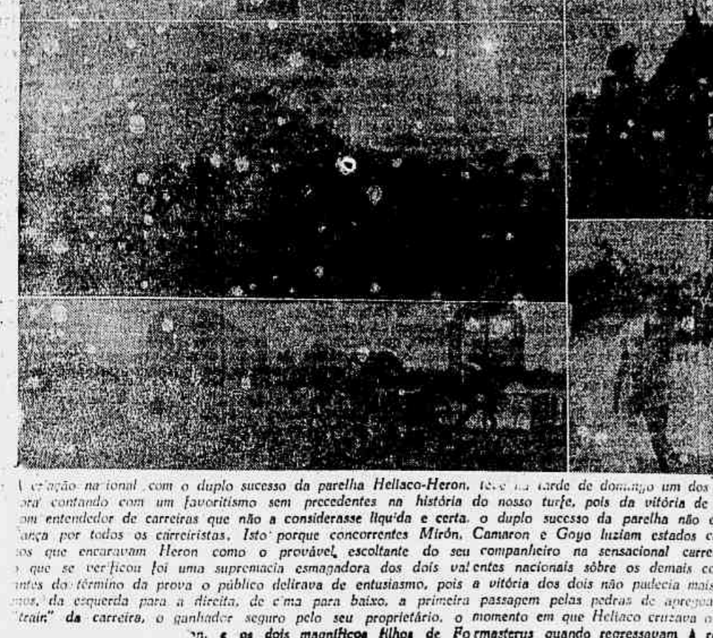
A criação na farm, com o duplo sucesso da parelha Helíaco-Heron, 12 e 13, na tarde de domingo, um dos seus dias de maior glória.