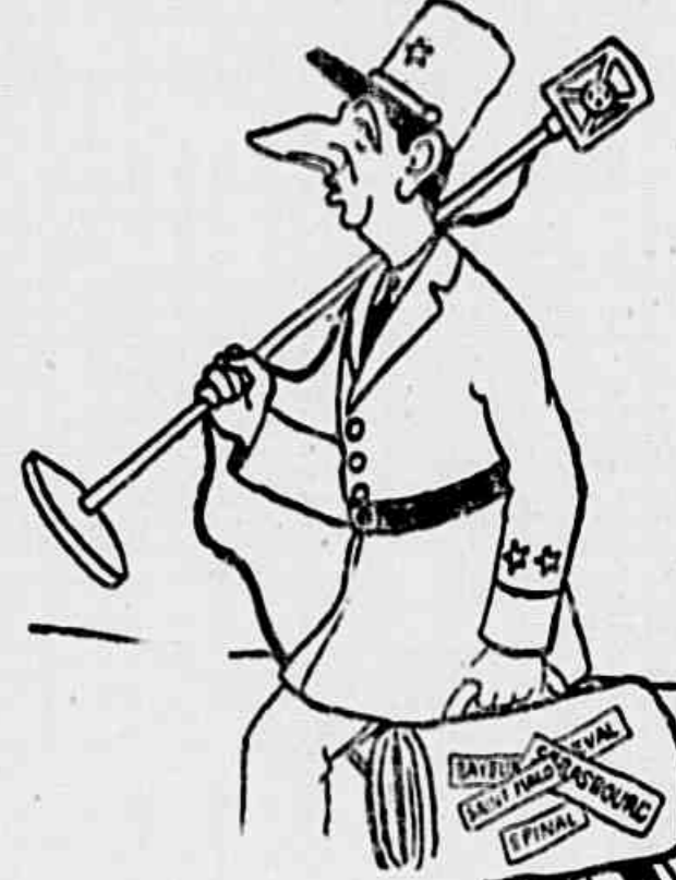
Este é um caricaturista francês e De Gaulle em sua pregação fascista pelas aldeias da Bretanha

importante, no que se refere à defesa da nossa democracia, ao mesmo tempo há preparação e os meios dentro do partido em matéria de reconstrução. A posição tomada pelo Sr. general De Gaulle tem uma significação muito precisa. Depois de encoberta a conjunção da nova «aquiescência, isto é, que o chefe da República está em preparação. E, como sempre, o ataque contra os comunistas não é uma questão de pura defesa, mas de uma luta geralizada contra os traítadores e todos os republicanos. Sr. general De Gaulle conchegou agora ao chefe da reação francesa. Este é a cabeça de uma organização, da qual devemos preservar a República. Comunistas, socialistas, republicanos de todas as tendências, centrais e não centrais, unidos numa defesa da República e da França que se tornará livre e independente, organizemo-nos para a defesa das instituições republicanas e para assegurar, sob o espírito da liberdade, os benefícios da nossa revolução, o triunfo de uma política de grandeur da França — de firmeza republicana.