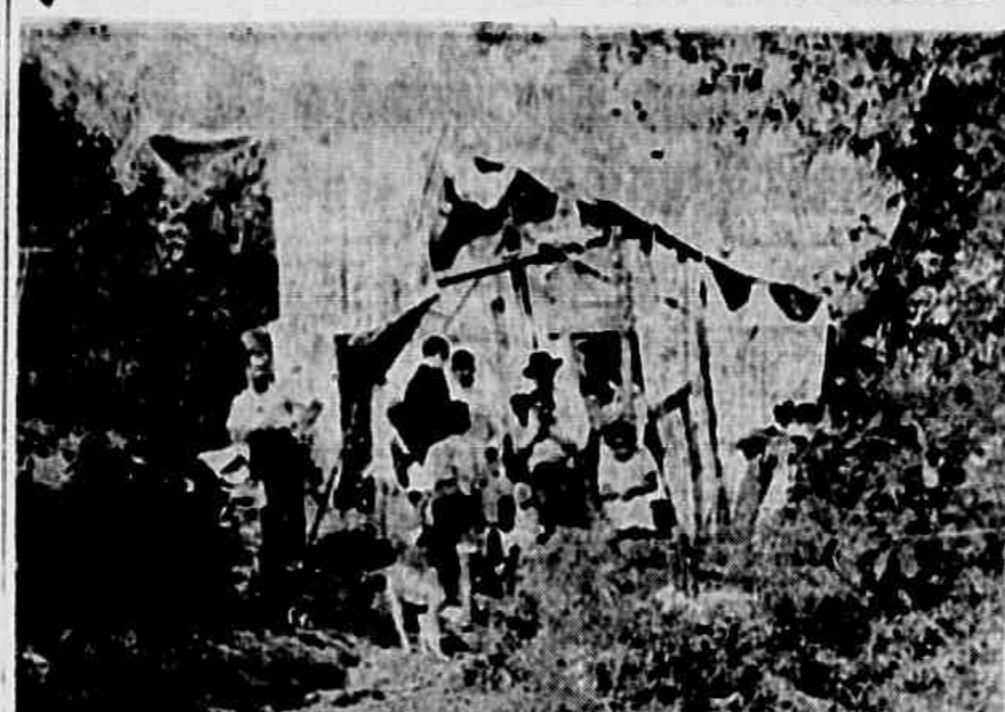
Os moradores do Morro do Martelo não se conformam com a derroba de seus barracos