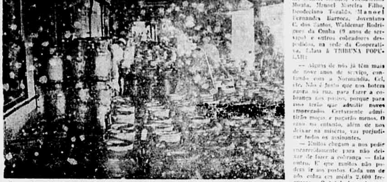
Depois de acabar com o fornecimento à domicílio em alguns bairros, a Cooperativa resolveu, também, abolir a cobrança.

CERCA DE 70 MIL ASSINANTES SERÃO PREJUDICADOS — 24 COBRADORES JÁ RECEBERAM O AVISO PRÉVIO — «BEBA MENOS E PAGUE MAIS», É O NOVO SLOGAN