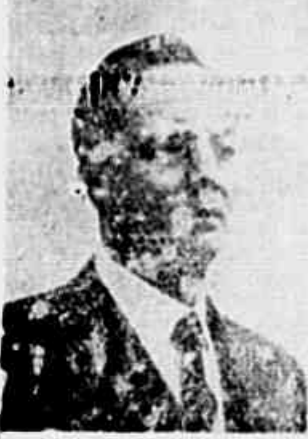
estado do presidente Berres, o vice-presidente Luis Batlle Berres, que acaba de assumir o governo, esteve em Buenos Aires e ali concedeu várias entrevistas à imprensa. Mas em alguns jornais o seu pensamento foi adulterado, sobretudo nas suas declarações sobre o Plano Truman, que naquele mesmo momento era alvo de um acalorado debate de vários dias na Câmara uruguaia, com a presença dos ministros de Defesa