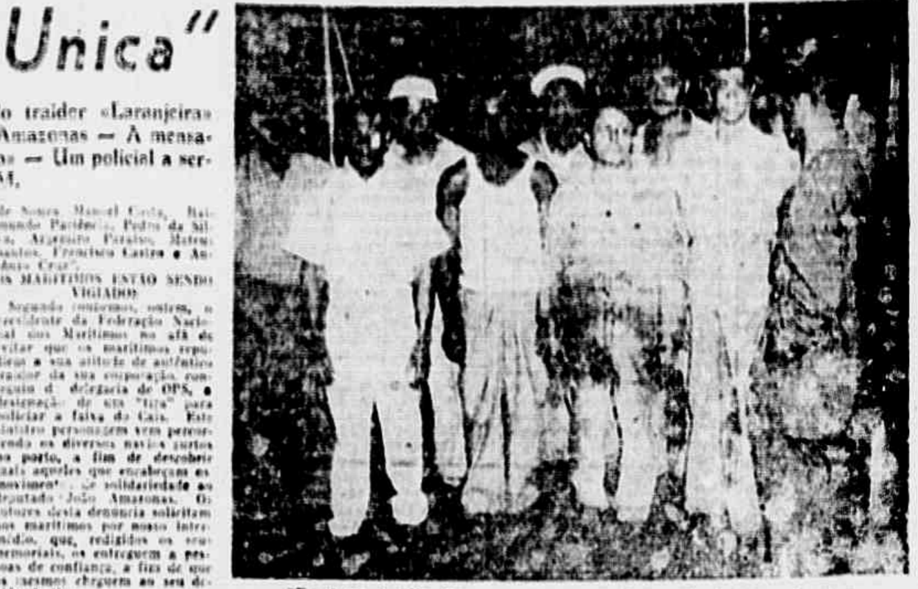
«Ainda não existe etapa única», Laranjeira está mentindo — A mesa de negociação

— «Hoje não jantei, Olhei para a comida e não pude trabalhar, comer o que nos pagam só de ano em ano, quando vem um mês com um pedaço de galinha. Para não morrer de fome, comprei leite e tomei com aveia. Assim falamos um dos tripulantes do «Herval».