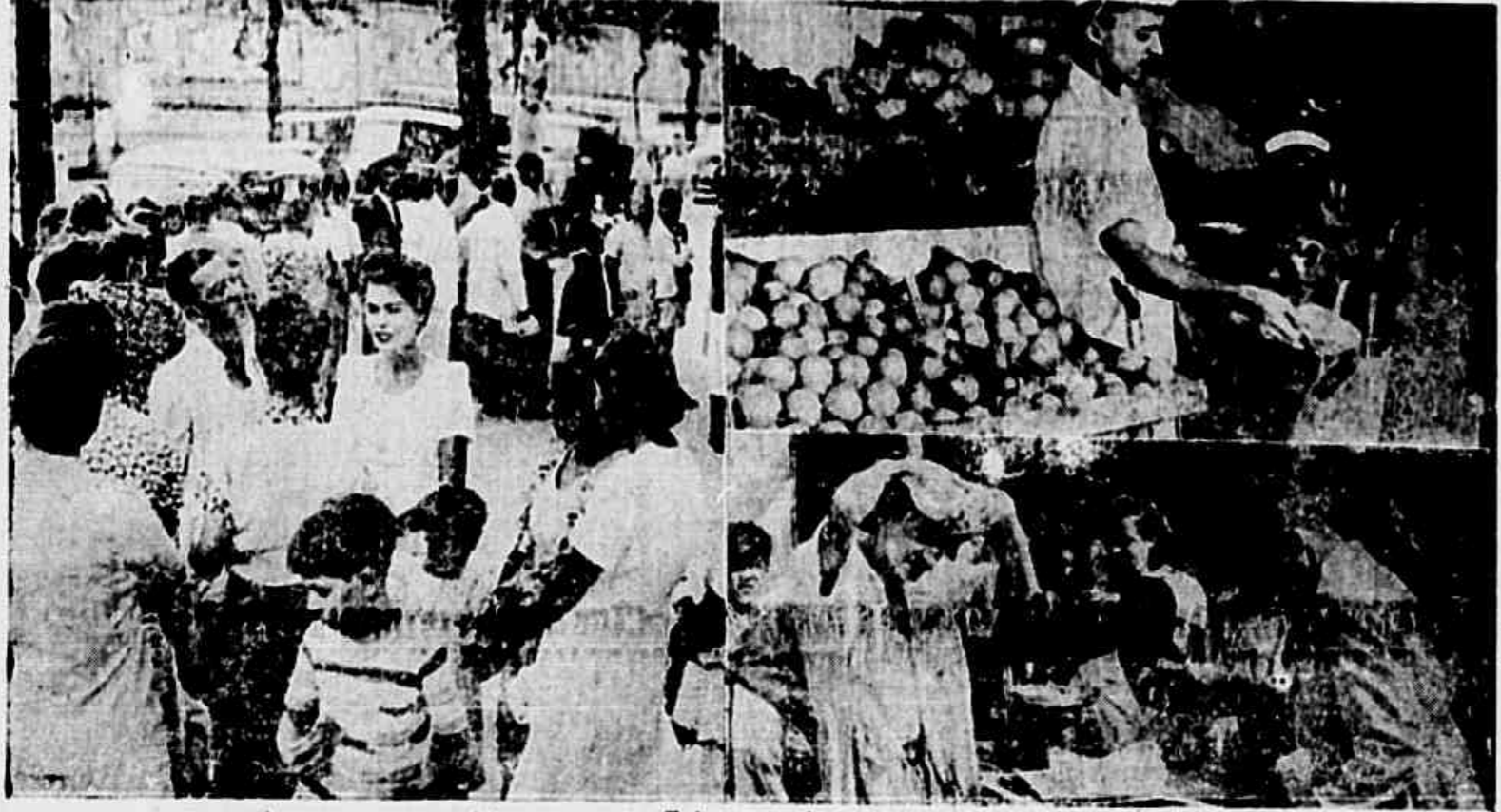
O povo vai às ruas e só topa com aumentos. Tudo é majorado, e neste ano, os preços sobem assustadoramente.

Defende o sr. João Amazonas o vultoso patrimônio dos trabalhadores, constituído pelo desconto compulsório do imposto sindical — O Banco do Brasil desconhece a lei de prorrogação da moratória nos pecuaristas — Verberadas ainda as ameaças de intervenção no Piauí — Debates sobre a lei eleitoral de emergência