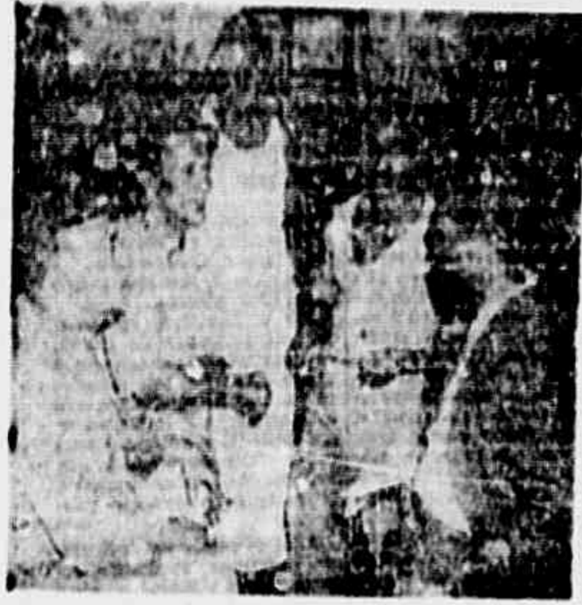
«Ainda não existe etapa única», Laranjeira está mentindo — A mesa de negociação

Assim respondem os marítimos às provocações do traider Laranjeiras — Cresce o apoio à iniciativa do deputado João Amazonas — A mensagem de solidariedade dos tripulantes do «Aragão» — Um policial a serviço do presidente da F.N.M.