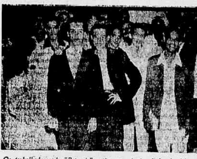
Os trabalhadores da «Petronio» estão na primeira linha de defesa do Sindicato. — Afirmaram à redação, os membros da comissão que aparece no clichê

Numerosa comissão de operários da «Fábrica de Calçados Petronio» veio à nossa redação hipotecar solidariedade à Comissão Central de Defesa do Sindicato — Organizada a Comissão de Defesa no local de trabalho — Confiam em que os representantes do povo na Câmara dos Deputados aprovem rapidamente o projeto de duplicação dos salários mínimos