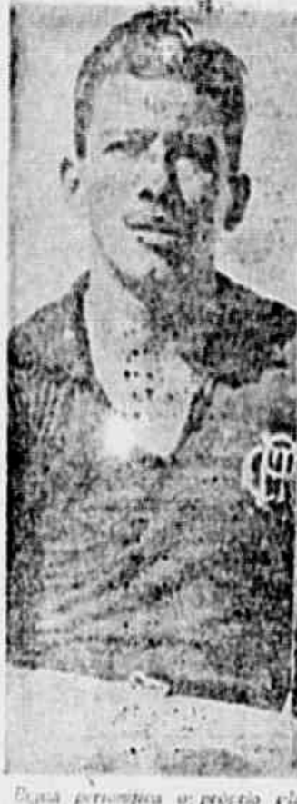
Uma perspectiva do projeto Flamengo, lutando sem desânimo...