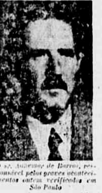
O sr. Adhemar de Barros, responsável pelas graves consequências ocorridas ontem, verificadas em São Paulo.

EM MORTO E VÁRIOS FERIDOS Em consequência dos incidentes e principalmente dos tiroteios, várias pessoas ficaram feridas e houve um caso de morte. Até o momento, calcula-se em 20 o número de feridos e ignorava-se se houve outros mortos.