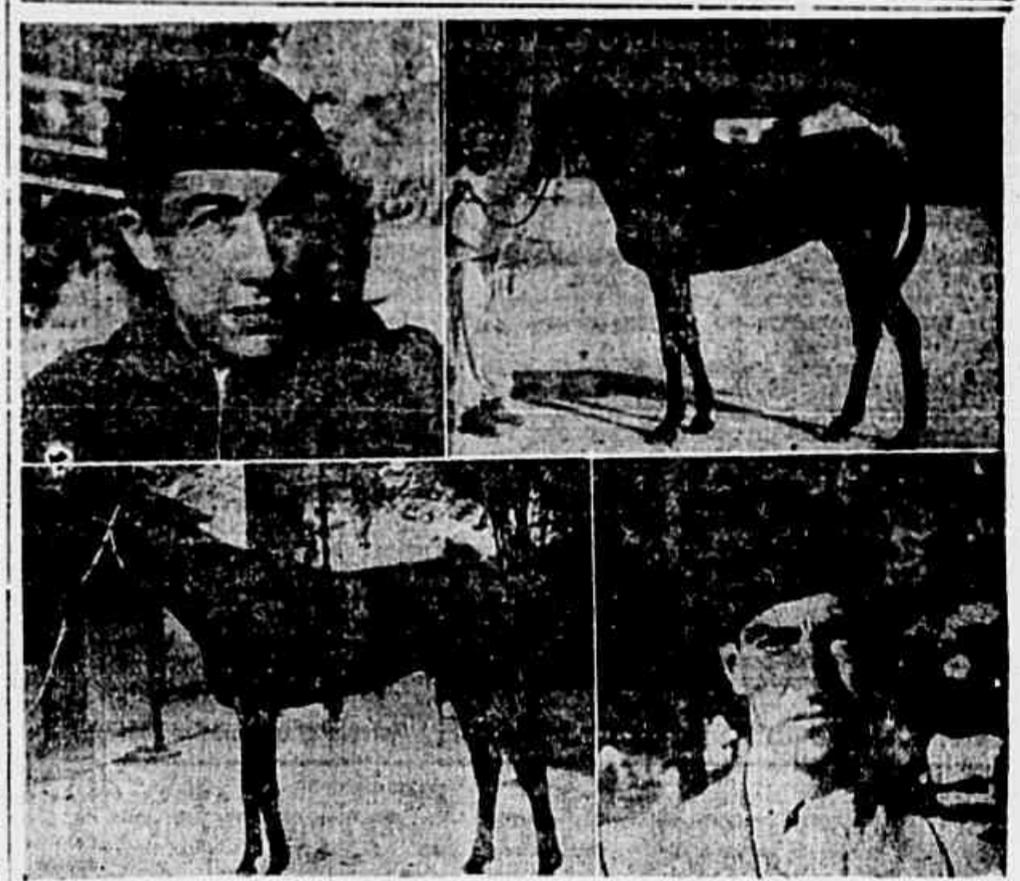
Pouco mais de 24 horas nos separam da sensacional disputa do Grande Prêmio Brasil...