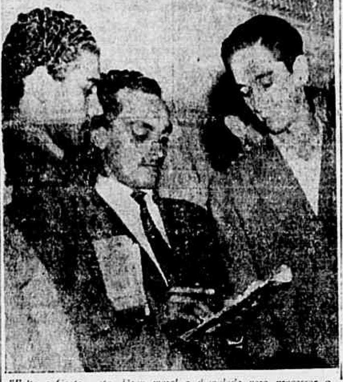
Falta a Costa, resto, força moral e dignidade para processar o "Senador do Povo" — dizem à reportagem os trabalhadores