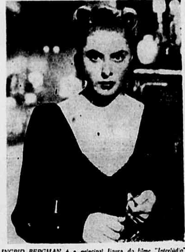
INGRID BERGMAN é a principal figura do filme "Intercédo", atualmente em exibição. Trata-se de ampla propaganda em torno do F.B.I., a pretexto de uma caçada de nazistas aqui no Rio...