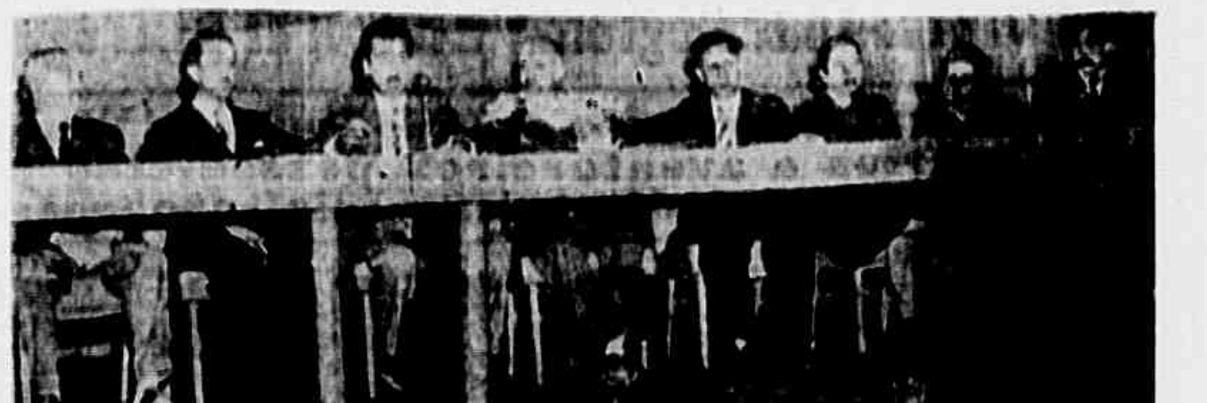
A CONFERENCIA DO ESCRITOR E DEPUTADO JORGE AMADO, ontem à noite na A.B.I., construiu, como bastião previsto, uma grande lista...