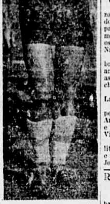
O médio Ivan