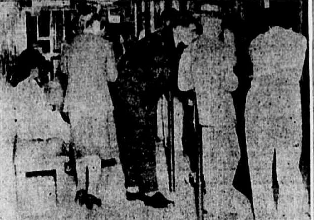
Nas casas de penhores a maioria vai para o «guichet» como quem vai vender a própria alma.