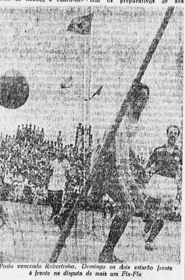
Pirita vencendo Robertinho. Domingo os dois estarão frente a frente na disputa de mais um Fla-Flu