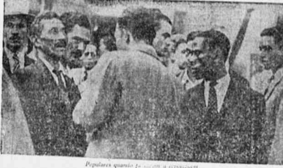
Populares quando foram a repórter

Acusado o Governo, Na Câmara, De Estar Preparando o Caminho Para a Liquidação Definitiva Da Constituição