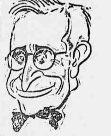
Mr. Truman, cujo sonho é substituir Hitler, atrelar o mundo ao carro de Wall Street