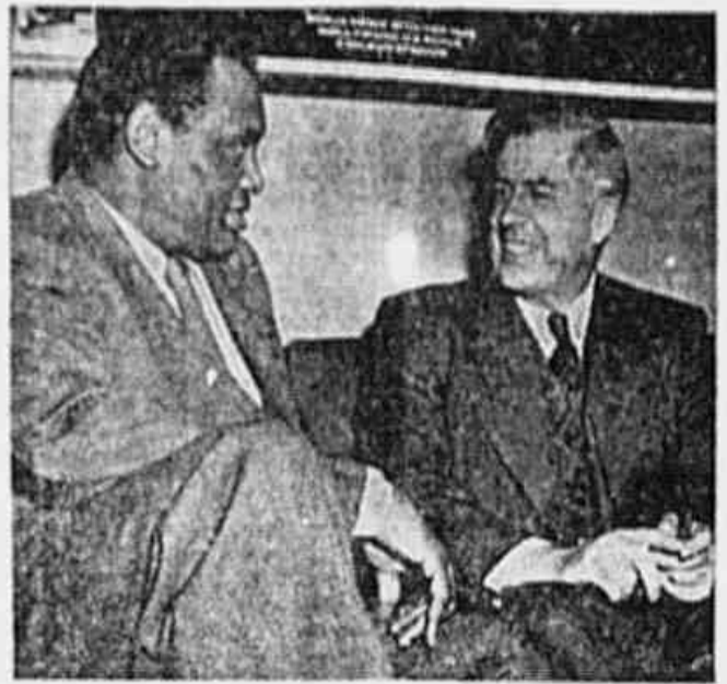
WALLACE aparece na foto acima, lado a lado pelo conhecido ator cinematográfico Paul Robeson, que participou de um recente comício em Chicago juntamente com o grande líder da luta mundial pela paz.