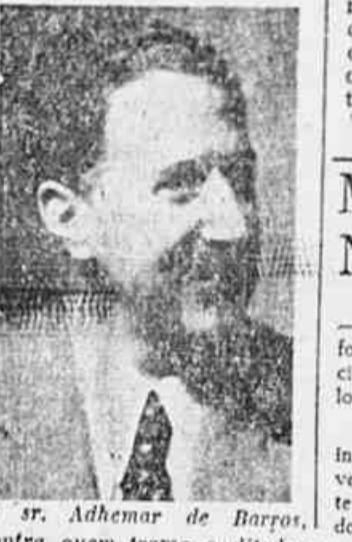
O sr. Adhemar de Barros, contra quem trama o ditador