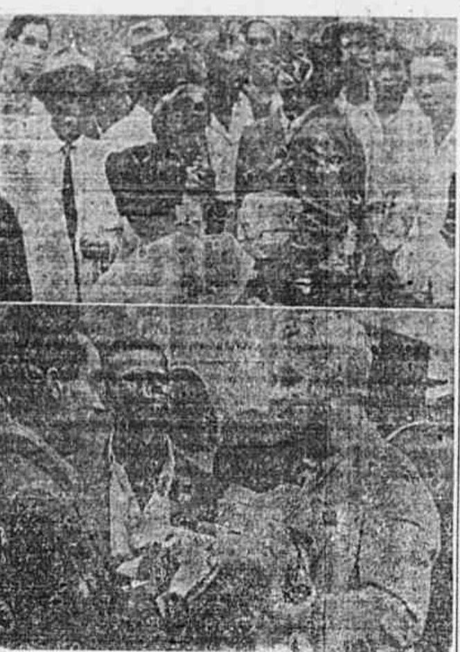
Populares falavam à nossa reportagem manifestando-se pela imediata renúncia do ditador e seus assessores, que instauraram no país o desgoverno