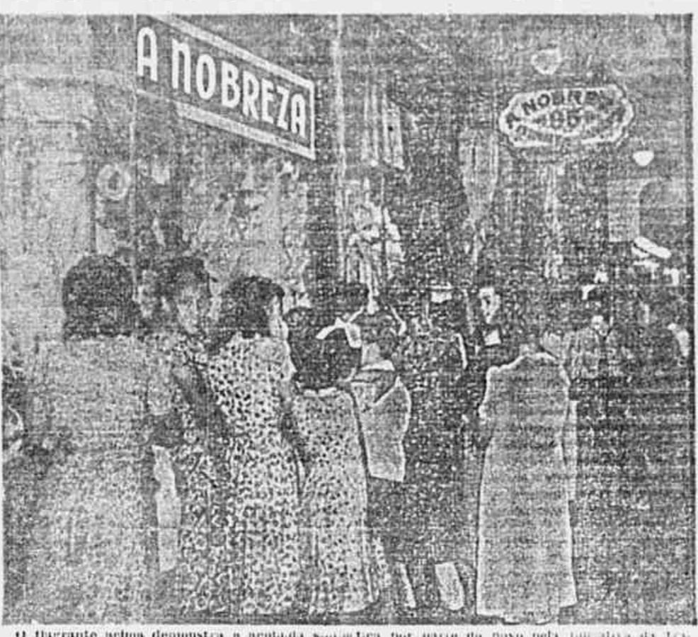
O flagrantíssimo demonstra a acuidade sempre por parte do povo pela iniciativa da tradicional A NOBREZA, a conhecida mascote das novas da rua Uruguaiana 85, que vem beneficiando a população facilitando a aquisição de tecidos populares. A NOBREZA tem se destacado com esse gesto, pela simples razão de ser a única no gênero da cidade, que ao receber tecidos populares se apressa em anunciar em vários jornais, convidando o povo para adquiri-los, embora se trate de artigos que não deixam lucros. Seu objetivo, pois, é beneficiar o público.