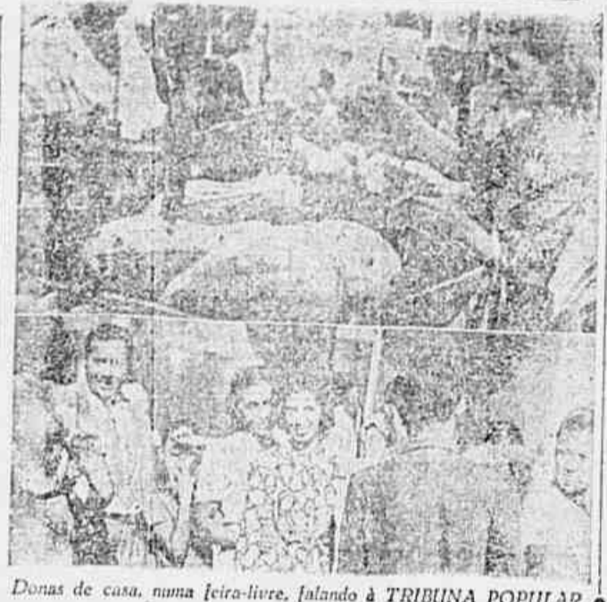
Donas de casa, numa feira-livre, falando à TRIBUNA POPULAR

ção, impedindo aqueles Dirigentes da Sociedade Civil "Partido Comunista do Brasil" a entrada e saída na Sede Central e nos demais Comitês. (Conclui na 2ª pag.)