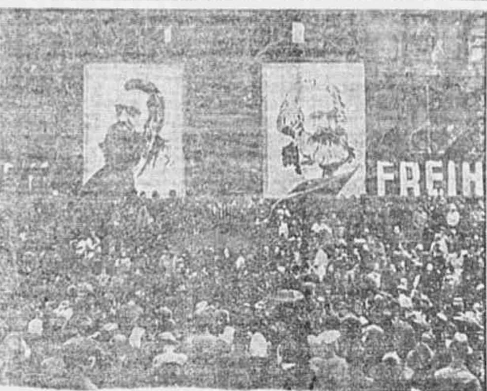
MANIFESTAÇÃO MONSTRO DE 1.º DE MAIO EM BERLIM — Grandes painéis com o retrato de Karl Marx (à direita) e Frederico Engels decoram as paredes do arruinado Castelo de Berlim, para o gigantesco comício do Lustgarten, no qual se reuniram cerca de duzentos mil pessoas para ouvir as palavras dos líderes sindicais sobre a grande data do proletariado. Os cartazes conduzidos pela massa reclamam um governo central, a constituição da paz e a unidade do movimento sindical mundial.