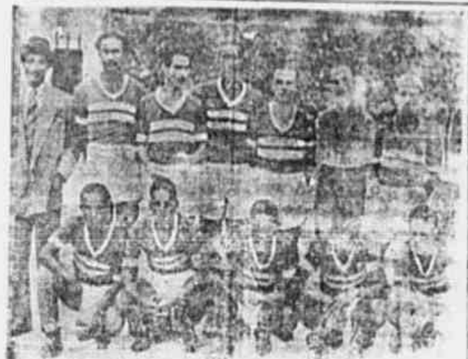
O QUADRO DO BANDEIRANTES - A equipe do velho clube, estreou no domingo último no "Campeonato Popular" conseguindo uma vitória sobre o Silva Teles...