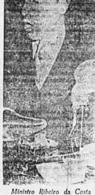
Ministro Ribeiro da Costa