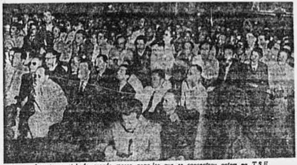
Aspecto parcial da grande massa popular que se concentrou ontem no T.S.E.