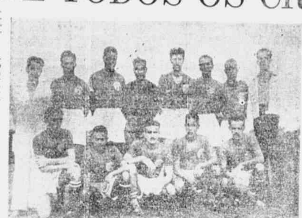
A forte equipe do Universol de Bonassura, que conquistou a Taça "Pedro Paulo".

atrás. Aos jogadores que cooperaram para o brilho da rodada, os agradecimentos da comissão organizadora do "Campeonato Popular". COOPERAÇÃO DOS DIRIGENTES DO MANUFATURA Desde que os organizadores do campeonato chegaram ao local das partidas, encontraram a maior boa vontade por parte dos dirigentes do Manufatura e dos funcionários do estádio. Todas as facilidades foram encontradas e daí o agrado de chamar a atenção a estes dirigentes e aos zelosos funcionários daquela praça de esportes. OS RESULTADOS DOS JOGOS E SEUS DETALHES O programa do "Campeonato Popular" marava quatro partidas oficiais e uma amistosa. Os jogos ofereceram resultados interessantes e seus detalhes serão encontrados abaixo: VITÓRIA DO STAR F. C. DA VILA O primeiro match reuniu as equipes do Star F. C. de Vila Isabel e do Estrela da Vila F. C. de Vila Isabel, embora o estádio do gramado prejudicasse a produção do time do Estrela da Vila, formado por elementos muito leigos. O vencedor da partida, mais ambientado com o terreno mo-