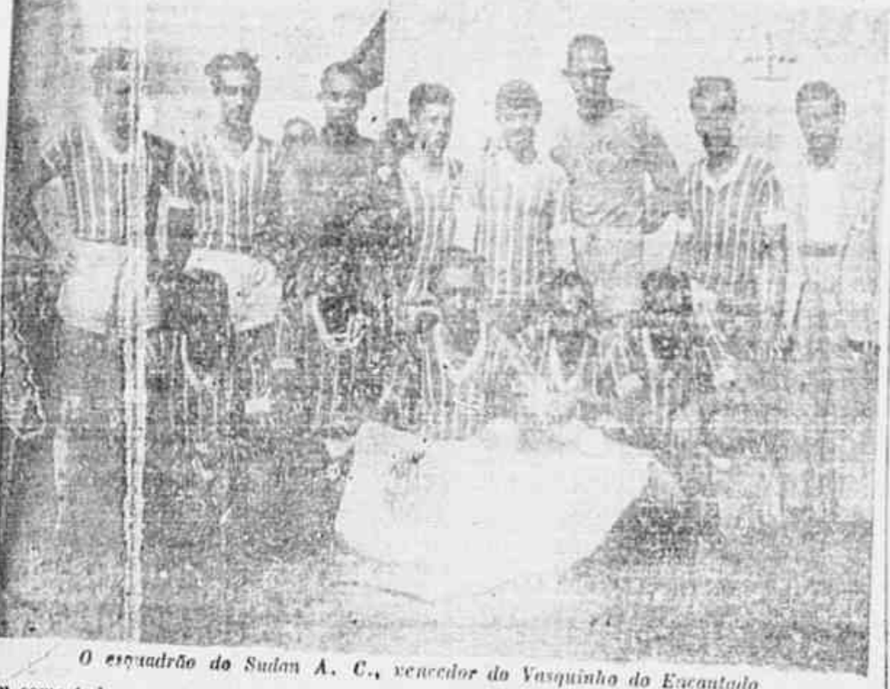
O esquadrão do Sulan A. C., vencedor do Vasquinho do Encantado.

Os jogadores da primeira etapa foram: Encantado (Sulân) 4 — H. B. (Sulân) 1 — Dória (Star F. C.) 4 — Nelson (Manufatura) 3