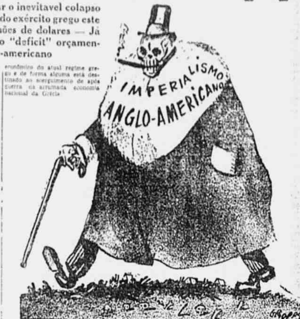
Desde a derrota militar do nazismo, vem a Grécia recebendo auxílio dos imperialismos inglês e americano, criado em cerca de um bilhão de dólares. Apesar disso e dos planos guerrreiros de Truman, é impossível evitar o colapso da sangrenta ditadura monarcho-fascista de Jorge II (Charge de GROPER, famoso caricaturista norte-americano).

Determinados comentaristas citam a conclusão de que o total de auxílio financeiro planejado pelo governo norte-americano pode apenas retardar o colapso