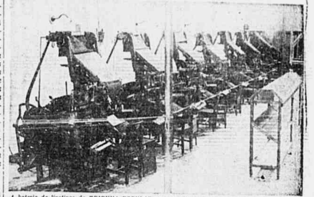
A bateria de linotipos da TRIBUNA POPULAR, uma vitória do povo que com tanto entusiasmo contribuiu para a Campanha Pró-Imprensa Popular