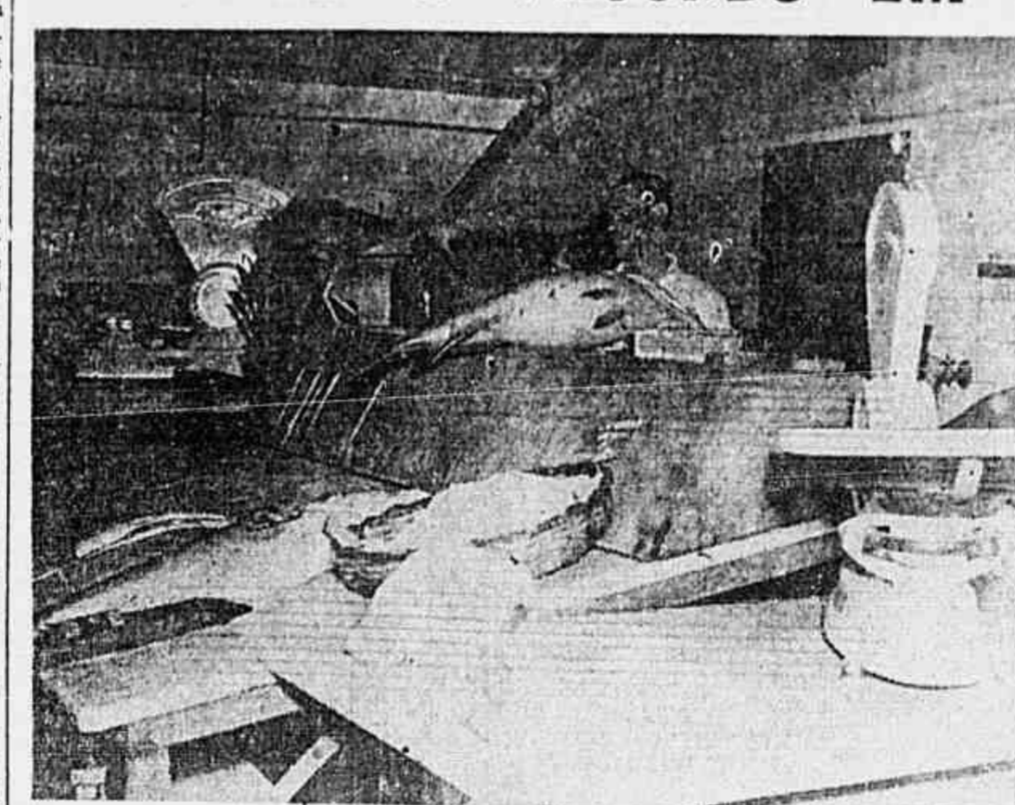
Com os preços da tabela, estes peixes não poderão estar á mesa do carioca na Semana Santa

A Comissão de Preços do Distrito tomou como base, os mais elevados preços atingidos na venda livre - Perspectiva para o carioca de uma Semana Santa em jejum forçado pelo novo tabelamento - "Tabelar assim é não conhecer as necessidades do povo"