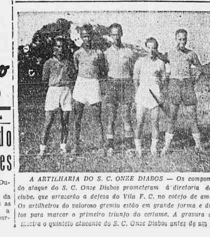
A ARTILHARIA DO S. C. ONZE DIABOS — Os componentes do ataque do S. C. Onze Diabos promoveram a detetoria do seu clube, que arrancou a defesa do Vila F. C. no cortejo de amanhã. Os artilheiros do valoroso gremio estão em grande forma e dispostos para marcar o primeiro triunfo do certame. A gravura acima mostra o quinteto atacante do S. C. Onze Diabos antes de um treino.