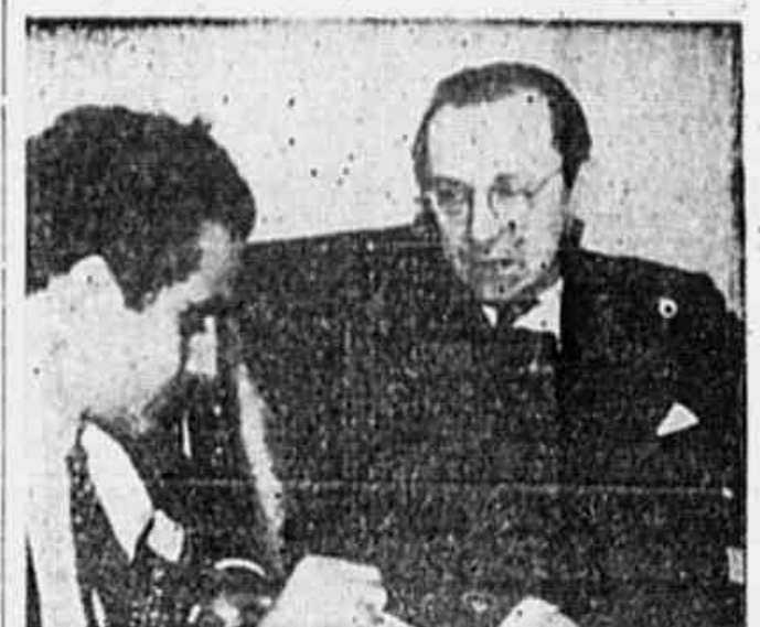
O pintor Portinari, quando falava á nossa reportagem ontem, na sede do Comité Nacional do Partido Comunista.

A PROCLAMAÇÃO "Ao povo da Republica! Nós, membros das unias Revolucionárias desta região militar, sen-