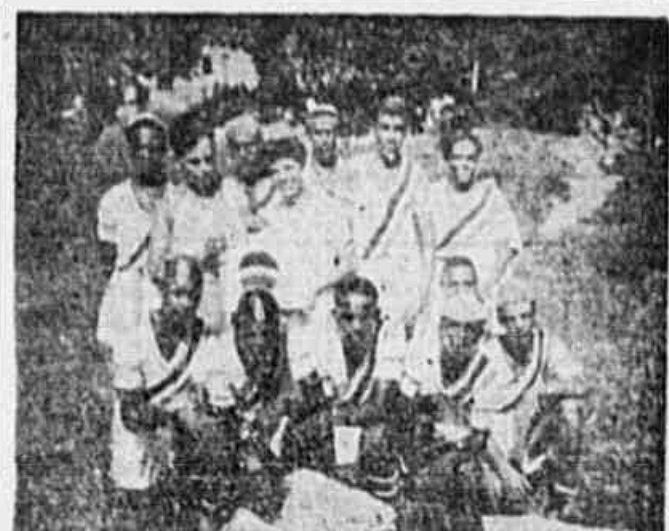
O ESPORTE CLUB ROCINHA — Estão prontos para o que vier o jogador do Esporte Club Rocinha, da Gávea. Os treinos terminaram e a rapaziada espera o dia da estreia no "Campeonato Popular" com grande ansiedade. A foto acima, mostra os defensores do valoroso club, em companhia de sua madrinha.

ferencia deste ou daquele desfilante na frente do outro. E' uma maneira lógica e razoavel para todos. INICIO A'S 21 HORAS Os clubes deverão estar no campo de S. Cristóvão meia hora antes, pelo menos, a fim de evitar atropelos e prejuizos para a boa ordem da parada. Os elementos que auxiliarão a Comissão Organizadora, apresentar-se-ão com bradeiras verde-amarela e estarão em condições de fornecer qualquer informação que for solicitada pelos interessados.