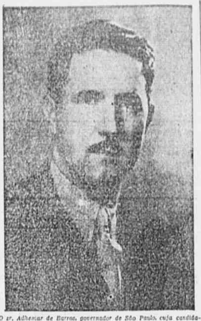
Dr. Adhemar de Barros, governador de São Paulo, cuja candidatura foi registrada sob a legenda PSP-PCB