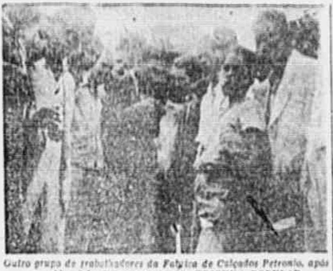
Grupo de trabalhadores da Fábrica de Calçados Petronio, após a saída, falando ao repórter da TRIBUNA POPULAR

300 operários sob as piores condições de trabalho — Falta absoluta de conforto e higiene — Salários de miséria e perseguição aos líderes sindicais no local de trabalho — Reforçar a USTDF e a CTB e levar todos para o Sindicato, é a maneira de lutar dos trabalhadores da firma F. Gallo & Cia.