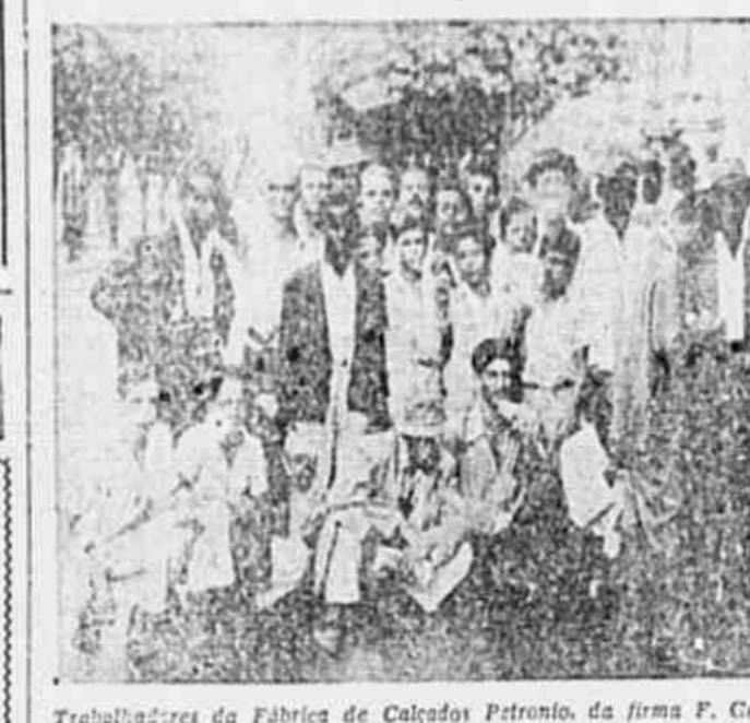
Trabalhadores da Fábrica de Calçados Petronio, da firma F. Gallo & Cia., contam à nossa reportagem as péssimas condições de trabalho existentes na Empresa

Quem passa pela praça Afonso Pena e vê a fábrica da Petronio, de propriedade da firma F. Gallo & Cia. não tem de leve suspeita de dificuldades e a apreensão que reinam naquele edifício.