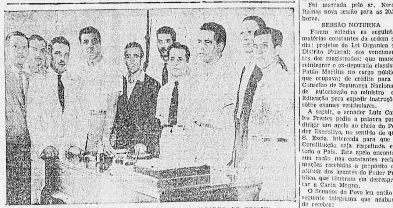
ARTISTAS E OPERARIOS DA CIA. LIRICA ITALIANA "CARRO DE TESPIS", que se encontra funcionando no teatro ao ar livre da Esplanada do Castelo...