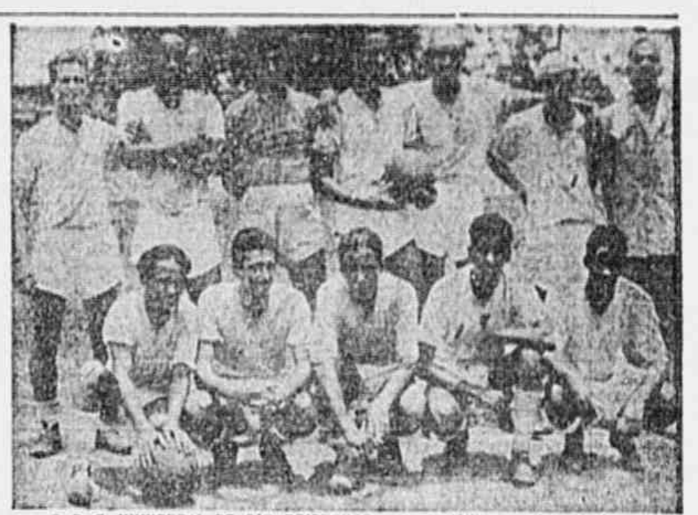
O S. C. UNIVERSAL DE SÃO CRISTÓVÃO — A rua Abílio e o reduto dos defensores do S. C. Universal, o valioso clube do bairro de São Cristóvão. Logo que foi anunciado o "Campeonato Popular", os dirigentes do referido clube, vieram à nossa redação a fim de inscrever o clube, e hipotecar a solidariedade pela ideia. Temos informações de que o referido clube é possuidor de uma equipe homogênea e difícil de ser esboçada, o que tem tornado maior o cariz da valorosa participação da rua Abílio. A gravura acima, fotográfica integrante do quadro do S. C. Universal, fotografia feita especialmente para TRIBUNA POPULAR.

— Como não? O nosso time é bom e pode aspirar o título. Quando existe entusiasmo e vontade de vencer, a coisa é mais fácil. A impressão que tenho, é de que conquistarei a faixa de campeão e a medalha que a TRIBUNA POPULAR oferece. O "Campeonato Popular" é uma ideia notável e que devemos apoiar em todos os sentidos.