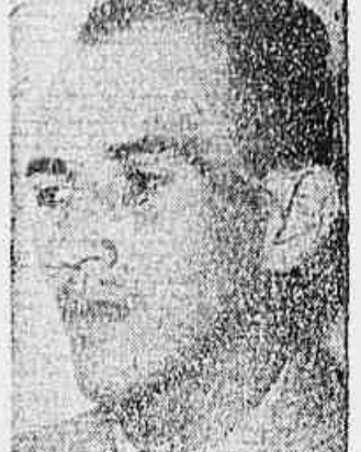
Campos da Paz