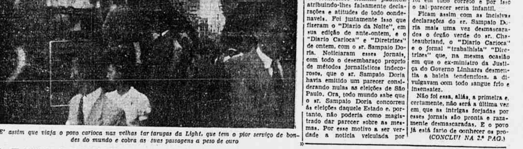
Assim que viaja o povo carioca nas velhas tararugas da Light, que tem o pior serviço de bondes do mundo e cobra as suas passagens a peso de ouro