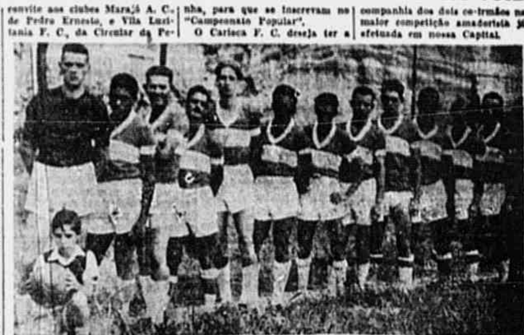
O quadro principal do Star F. C. de Botafogo, já inscrito no "Campeonato Popular"

Reunião dos presidentes Está marcada para hoje às 20 horas, uma reunião dos presidentes na sede do C. R. do Flamengo, cuja finalidade principal é discutir as modificações nas leis da F.M.F.