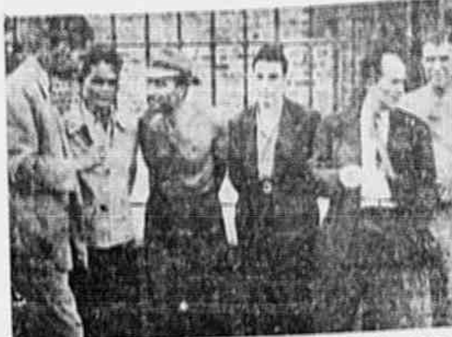
Os marinheiros gregos, uns ainda em traje de trabalho, falam à TRIBUNA POPULAR

Navios gregos cruzam todos os mares, tripulados pelos bravos da guerra, sem tocar, pelo menos, o solo patrio, porque os armadores têm seus negócios altamente lucrativos — Enquanto isso o povo grego passa fome e se humilha ante a permanência das forças imperialistas da Inglaterra — Protesto dos marinheiros do "Atlantic Breeze"