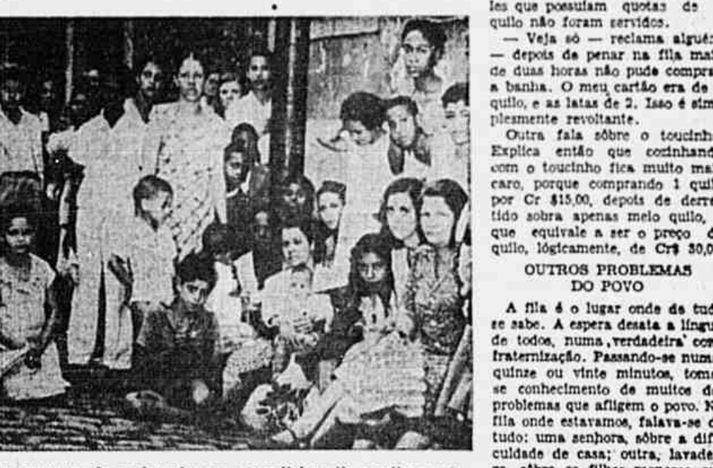
As filas continuam. Nas portas dos açougues, de madrugada; nos mercadinhos, dia e noite; em todos os lugares e para tudo. Pergunta o povo: "Até quando?"

O que dizem os populares da fila da carne — Aumentaram o preço da banha, mas o produto continua desaparecido — No Mercadinho São Paulo só vendem latas de 2 quilos, de forma que os que têm quotas de 1 quilo não podem adquirir a mercadoria — O Departamento de Abastecimento não toma a serio