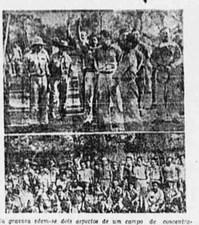
Na praça vêem-se dois aspectos de um campo de concentração do Paraguai, onde o impenitente ditador Morinigo encerra os melhores filhos do povo guaraní.

O golpe de Morinigo foi contra a democracia e o progresso do Paraguai — O ditador, que não conta com o apoio do Exército, recorre aos "slogans" anti-comunistas para justificar abusos