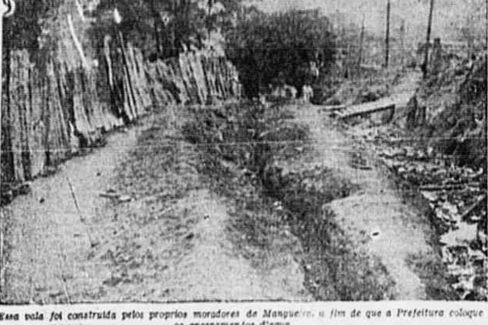
Essa vila foi construída pelos próprios moradores de Mangueira, a fim de que a Prefeitura coloque os encanamentos d'água