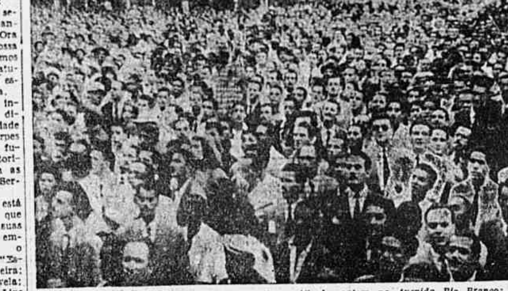
As fotos acima fizam dos aspectos do incendio verificado, ontem na Avenida Rio Branco; em cima os jovens empregados da casa comercial que ando deslcam, em trajes masculinos, as escadas dos bombeiros a fim de se salvarem das chamas que ameaçavam o terceiro andar. Em baixo a grande massa popular que assistia o sinistro