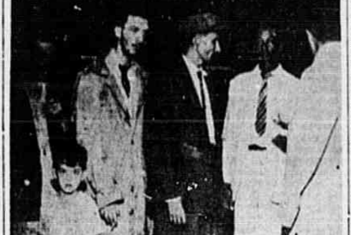
Na praça Cruz Vermelha a nossa reportagem conversa com profissionais do volante.