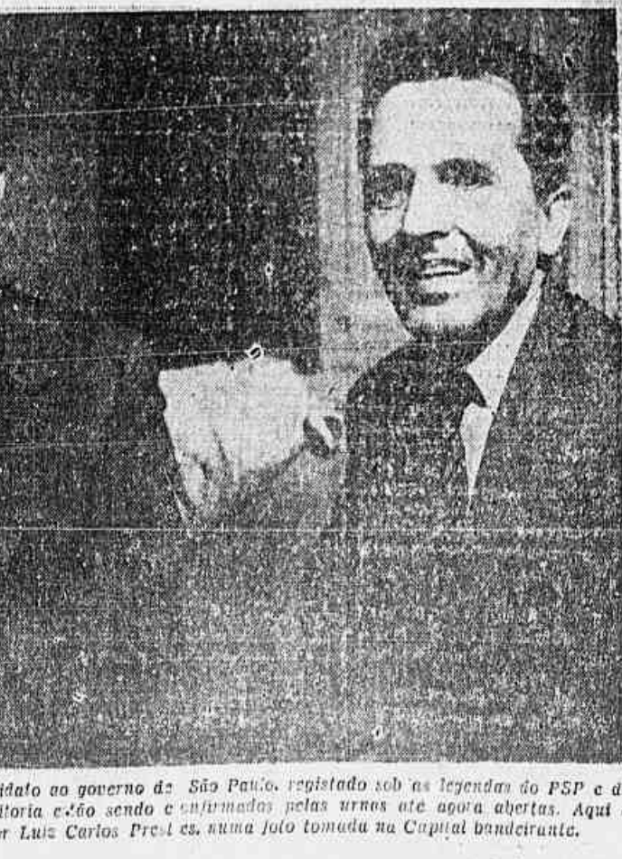
O sr. Adhemar de Barros, candidato ao governo de São Paulo, registrado sob as legendas do PSP e do PCB. Os prognósticos de sua vitória estão sendo confirmados pelas urnas até agora abertas. Aqui o vemos no lado do Senador Luiz Carlos Prestes, numa foto tomada na Capital baiana.

SHANGAI (TASS, pela Inter-Press) — O movimento anti-americano na China continua a crescer. Apareceram na cidade novos panfletos pedindo a retirada das tropas americanas. O presidente da Associação dos Estudantes reuniu-se para protestar contra atos de coerção cometidos por americanos, e adotou a seguinte resolução: realizar ainda em janeiro uma campanha de protesto contra os atos de coerção cometidos pelos ame-