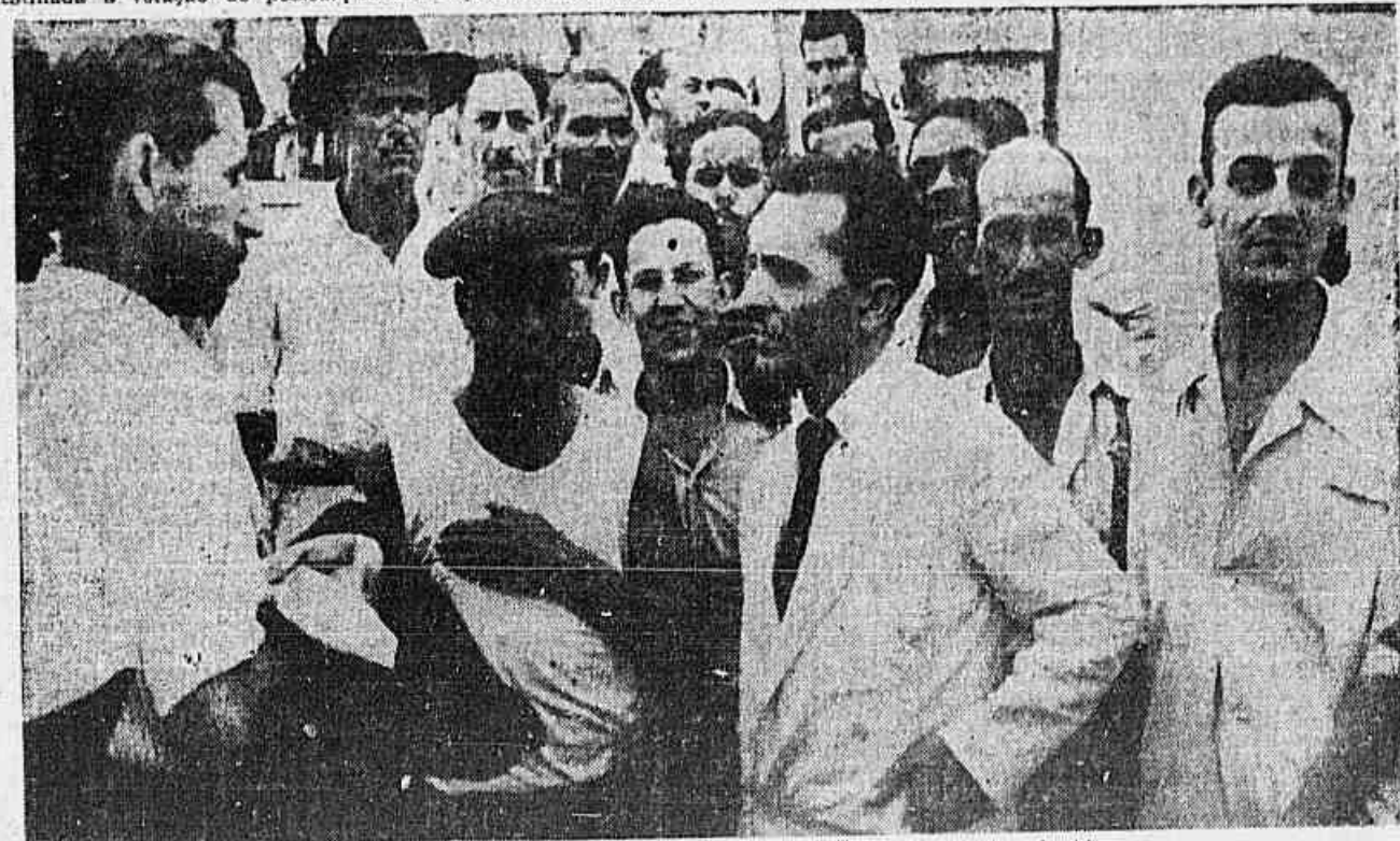
Prestes cercado por populares em uma das seções eleitorais do subúrbio

O deputado João Amazonas, candidato à terceira senadoria pelo PCB, votou às 10 horas da manhã na 66.ª Seção, instalada na garagem do edifício de apartamentos situada à rua Senador Verqueiro, n.º 22. Depois de exercer o direito do voto, o futuro senador carioca permaneceu acompanhando os trabalhos de uma seção contígua à em que votara, os quais não decorreram com o desejado desembarco, tendo-se retirado em seguida para percorrer seções do subúrbio, onde foi reconhecido e aclamado pelo povo.