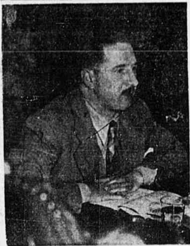
Sr. Ademar de Barros

tuídas divertis ornamentaram o local do comício, ao qual co- mpareceram inúmeros organiza- mentos partidários, grupos profissio- nais, trabalhadores em Carris Ur- banos, sapateiros, graficos, e di- versas delegações do interior, que vivavam constantemente a Pres- tes, o deputado Carlos Marighel- (CONCLUI NA 2.ª PAG.)