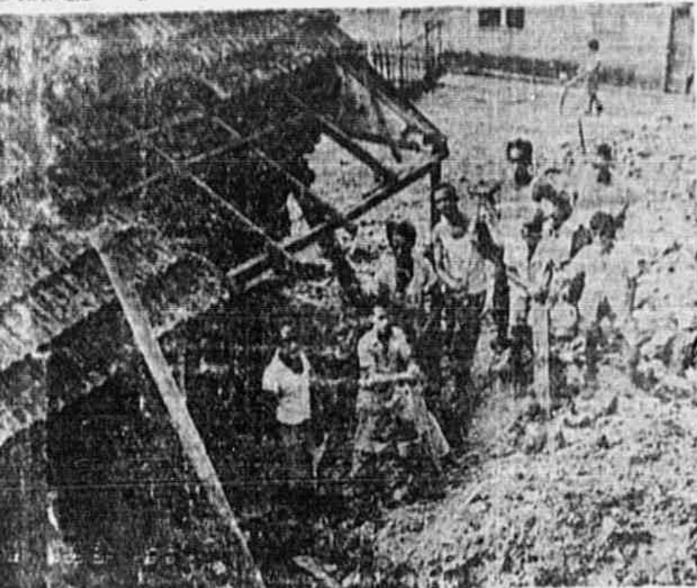
NA RUA SÃO ROBERTO, NO LUGAR DE SÃO... (caption text describing the scene in the photo)