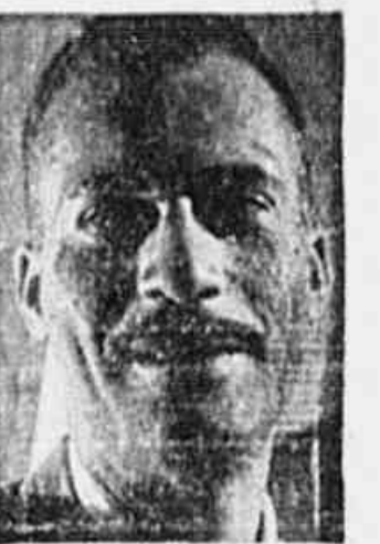
Deputado Carlos Marighella. A emenda Carlos Marighella, que concede o benefício também aos servidores da Nação inativos pensionistas e militares reformados. Foi rejeitada a emenda Maurício Grabols-Carlos Marighella, assim redigida: "Art. 1.º — A todo servidor do Estado, civil ou militar, seja qual (CONCLUI NA 2.ª PAG.)

A emenda Carlos Marighella, que concede o benefício também aos servidores da Nação inativos pensionistas e militares reformados. Foi rejeitada a emenda Maurício Grabols-Carlos Marighella, assim redigida: "Art. 1.º — A todo servidor do Estado, civil ou militar, seja qual (CONCLUI NA 2.ª PAG.)