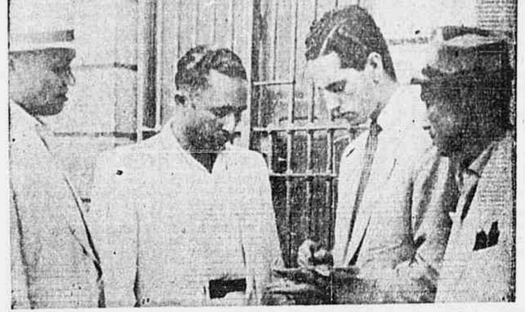
"A vitória das próximas eleições será dos operários, do povo e do seu Partido"

Esos do continente para satisfazer seus interesses, frustrar as aspirações democráticas e patrióticas do povo brasileiro e esmagar o movimento operário em nossa pátria, do qual o nosso Partido é, nos dias de hoje, a expressão mais honesta e consequente. O Pleno do Comitê Nacional diz a todo o Partido que o avanço da democracia não está apoiado numa frente democrática uni-