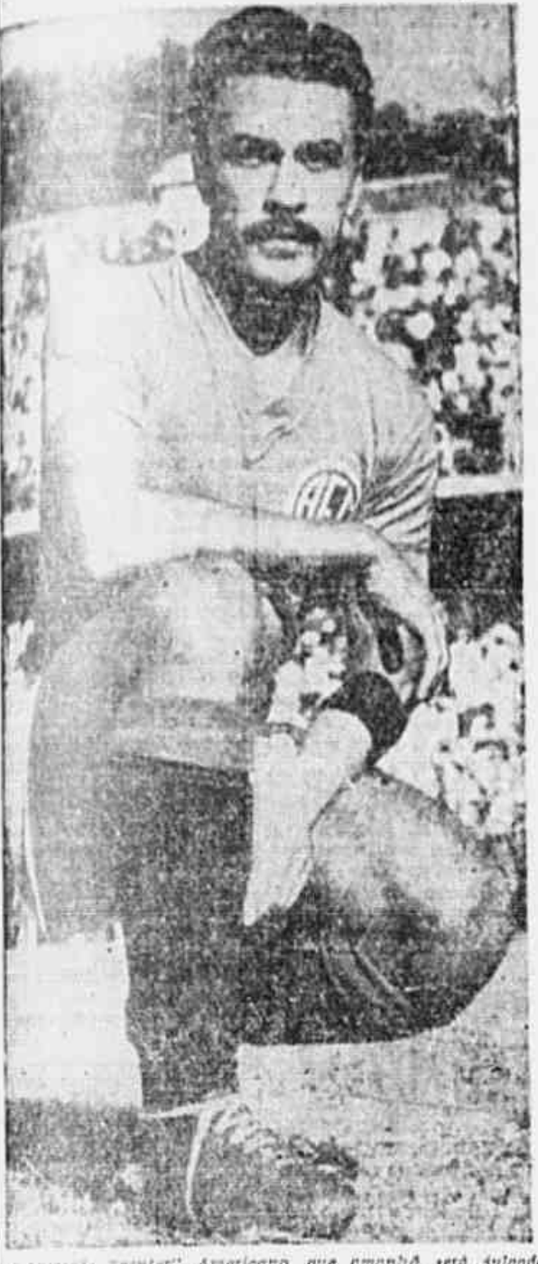
... "center" Americana, que amanhã será julgada pelo Tribunal de Justiça da F. M. F.

GRANDE O NÚMERO DE PROCESSOS EM PAUTA — VARIOS PROFISSIONAIS INDICIADOS — A RELAÇÃO DISTRIBUÍDA