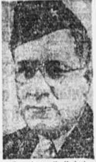
Gen. James K. Herbert

E' por isso que se opõem à desnazificação e à destruição das raízes econômicas do fascismo