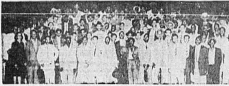
CERCA DE UMA CENTENA DE TRABALHADORES DA CONSTRUÇÃO CIVIL esteje, ontem, em nossa redação...