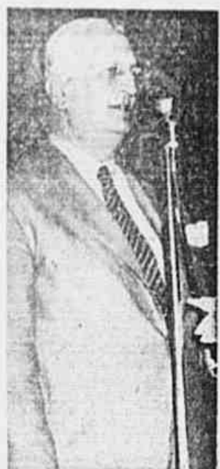
Senador Abel Chermont