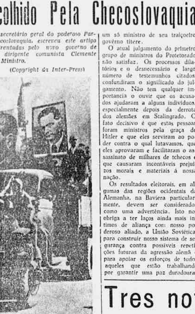
Pela segunda vez desde que os invasores alemães foram expulsos da sua Patria, o povo eslovaco comemorou festivamente o aniversário da insurreição de 1944 contra o dominador nazista. Veja na fotografia os retratos do Presidente do Partido Comunista Slovaco, junto com o do Generalissimo Stalin.

Em uma sessão rápida, que não teve oradores, o Senado votou o crédito de 11 milhões de cruzeiros para atender às despesas com o prosseguimento da construção da rodovia Ponta Grossa-Foz de Iguaçu.