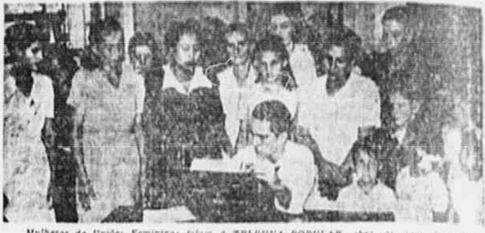
Mulheres de União Feminina falam à TRIBUNA POPULAR sobre os seus trabalhos.

Esta União conseguiu fundar uma Cooperativa de Consumo e luta pela criação de um restaurante popular, tipo SAPP, que possa servir refeições baratas e a domicílio. Também estudam a