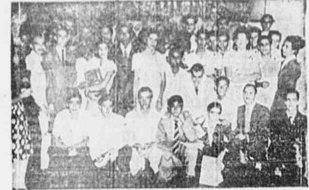
REUNIAO EM GREVE DOS JOVENS DO "INSTITUTO COMERCIAL BRASILEIRO". PEDINDO A IMEDIATA RETIRADA DE UMA TAXA INJUSTA E ILEGAL. — Voto ontem à nossa redação a comissão de senhoras paulistas a fim de apelar para as bancadas de todos os Partidos em representação na Câmara e no Senado para que intervenham no sentido de evitar que se consumem os propósitos do Secretário da Agricultura de São Paulo, de fechar a Escola de Aplicação ao Ar Livre, que funciona no Parque de Água Branca, no centro da capital candicante.