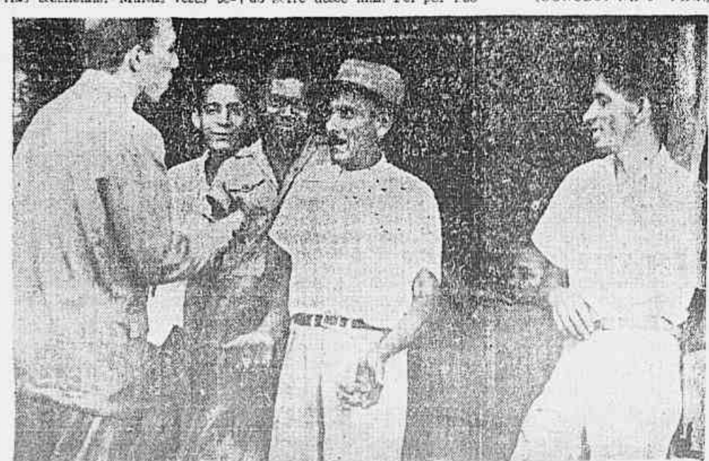
"O povo já não crê em promessas". "Os vereadores que façam alguma coisa pelo povo, podendo começar por lutar contra o cambio negro, a os restis da vida e resolver o problema da terra" — dizem os trabalhadores