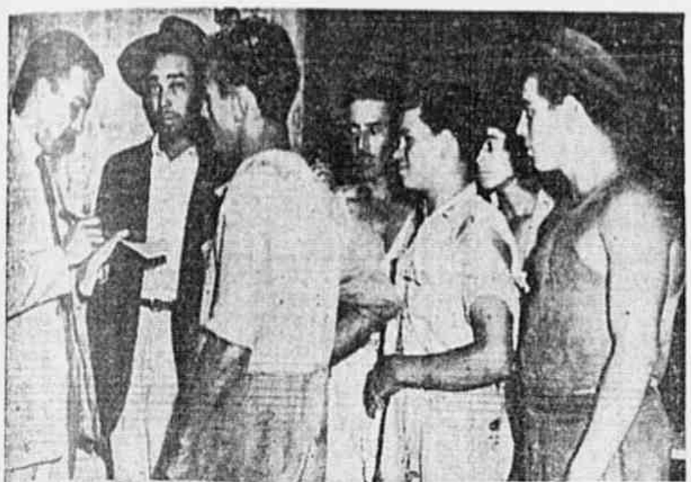
Trabalhadores quando, fala ram á TRIBUNA POPULAR

UNIDADE DEMOCRACIA PROGRESSO ANO 1 N.º 463 SEXTA-FEIRA, 6 de DEZEMBRO de 1946