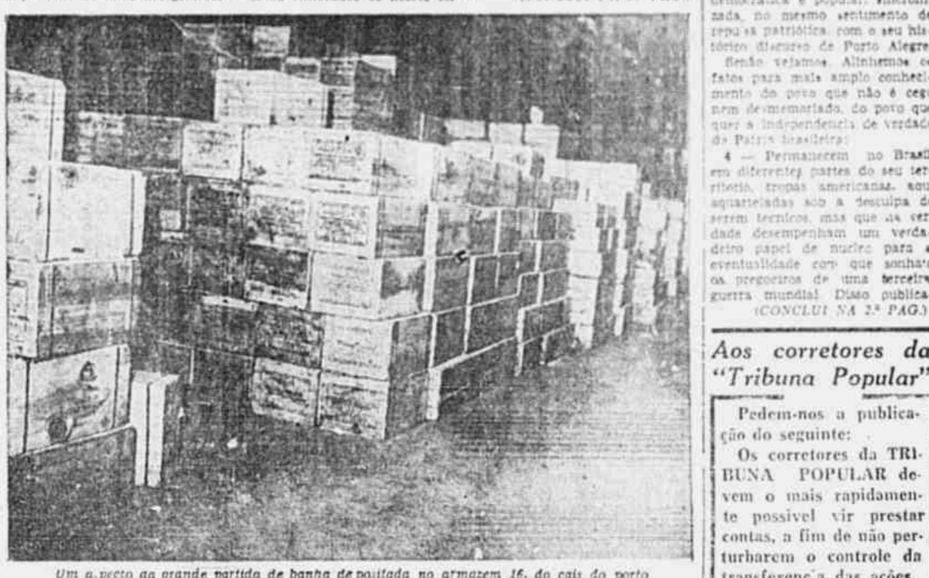
Um aspecto da grande partida de banha de positada no armazem 16, do cais do porto

Mais de 60.000 quilos no armazem 16 — O produto seguirá para Minas Gerais em busca de preços altos A manobra dos produtores da banha para o aumento de preço desse produto de primeira necessidade está obtendo, ao que se deduz pelas declarações do sr. Morvan Figueiredo á imprensa, as boas graças do Ministério do Trabalho. Para-se já da equiparação de preços em todo o território, o que significa uma preparação psicologica para a aprovação do pleiteado assalto á bolsa do povo carioca, com o aumento de cinco cruzeiros em quilo, desde que ninguém é tão ingenuo para acreditar numa possível baixa geral de preços... Argumentam os produtores e, desse argumento, parece participar o ministro do trabalho, que há falta do produto. Nesse caso a conclusão que, mesmo com o anunciado aumento, a banha