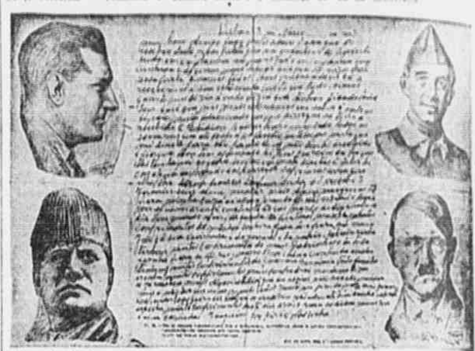
Os quatro ditadores fascistas aparecem nesta carta-postal anti-comunista. Dois já foram mortos e dois restantes não fazem mais companhia a ninguém.

terras, Salazar criou um "Fundo Anti-Comunista", com sede à rua do Ouro, 212, em Lisboa. Desde essa época, os salazaristas passaram entre outros meios de propagação da fascista, a distribuir largamente a "Carta-Postal Anti-Comunista", que aqui reproduzimos. Na distribuição, os quatro ditadores apareceram juntos, com suas características sinistras. Dizia-se: "Os quatro ditadores fascistas aparecem nesta carta-postal anti-comunista. Dois já foram mortos e dois restantes não fazem mais companhia a ninguém".