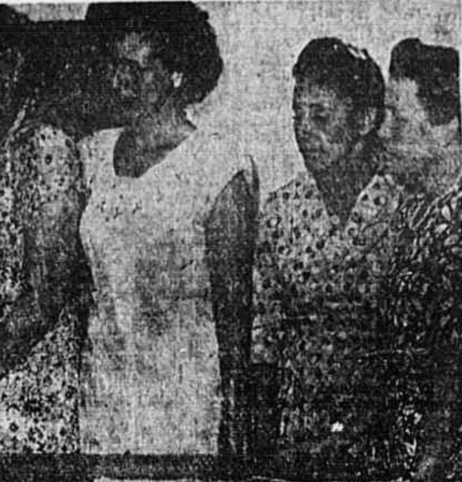
Diretoras da União Feminina de Pedro Ernesto e Ramos quando, em nossa redação, falavam sobre o comício do dia 24