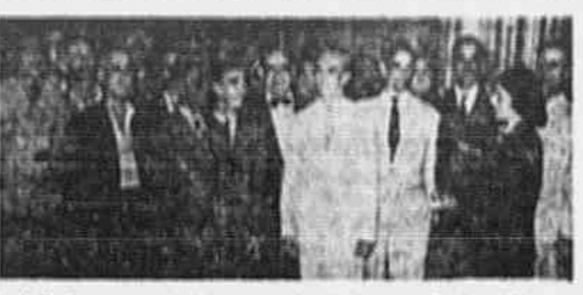
Trabalhadores em minérios e combustíveis, quando da visita que fizeram à nossa redação.

Finalizando, pediu-nos que registrássemos o apelo que dirige aos empregadores em nome da corporação, no sentido de que compreendam que são milhares de homens e mulheres que, pedindo um justo e razoável aumento de salários estão, apenas, lutando contra a fome e a necessidade que cresce em seus lares. Assim, como disse o operário, a corporação toda espera que os donos das empresas não criem dificuldades a uma solução conciliatória, apresentando termos de acordo que possam ser aceitos.