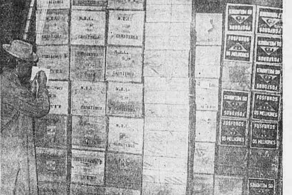
Nada mais expressivo que o flagrante acima para bem caracterizar a ação dos interessados em majorar o preço dos forforos incrustantes na cidade

de preços na capital do País e principais cidades, enquanto se deixa todo o interior à mercê dos açambarcadores do povo, seqüelas de lucros. E o resultado dessa maneira de governar para impressionar o exterior é o que vemos — falta absoluta de muitos dos gêneros de primeira necessidade em toda a capital, sem que até o momento as autoridades