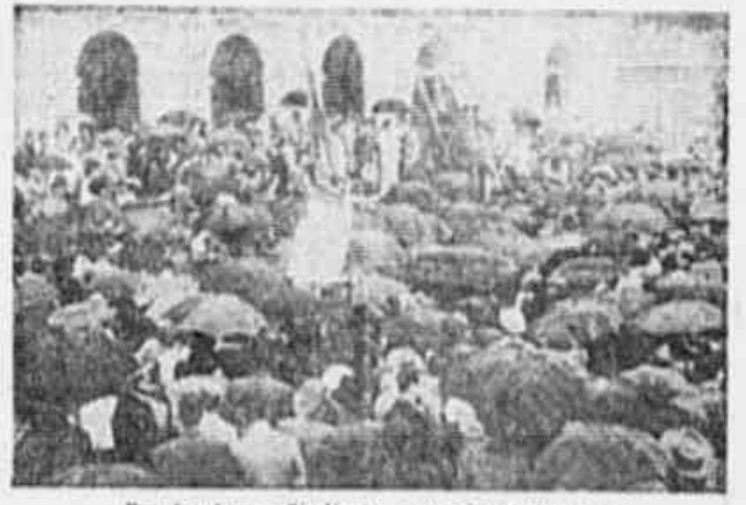
Em frente ao Sindicato, operários reúnem-se

Trabalhando apenas alguns dias no mês, milhares de operários viram a situação das suas vidas agravar-se de uma maneira trágica. Não era, de forma alguma, mais possível permanecerem nessa situação de fome e extrema miséria. De resto, os patrões nada faziam no sentido de resolver satisfatoriamente esse estado de coisas, uma vez que os grandes lucros por eles armazenados à custa da exploração