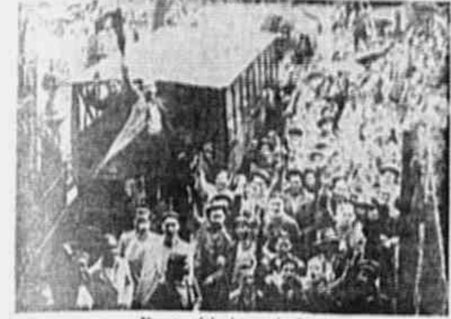
Um comício improvisado

Lutando pela garantia de 48 horas de trabalho, cerca de 15.000 tecelões de Petropolis declararam-se em greve