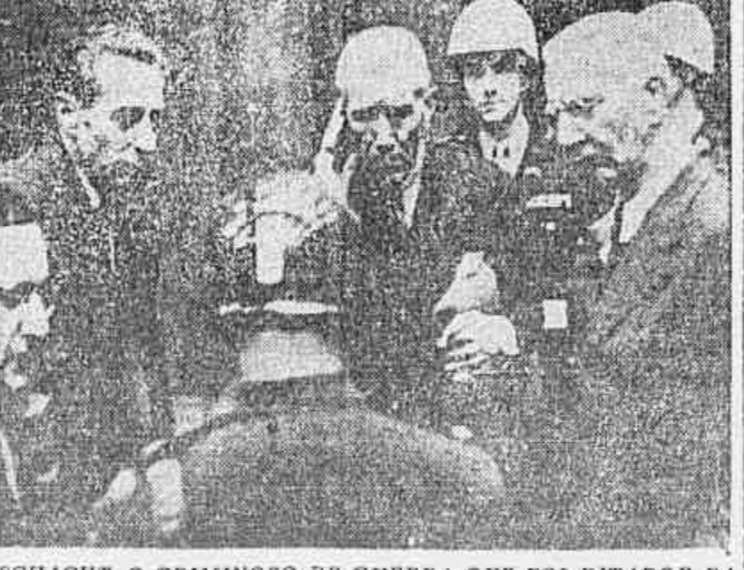
SCHACHT, O CRIMINOSO DE GUERRA QUE FOI DITADOR DA FINANÇA NAZISTA, aparece no clichê ao alto à direita de Von Lagen, ex-embaxador de reconhecida habilidade, também apontado pelos juizes anglo-americanos de Nuremberg, no momento em que ambos eram postos em liberdade. Schacht foi antes-então preso pelas autoridades alemãs.