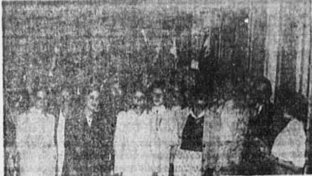
Operários da "Standard Elétrica" em nossa redação